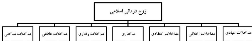
شکل ۲: ساختار مداخلات در زوج‌درمانی اسلامی

و رفتارها بررسی کرد. در الگوی اسلامی دو محور جدید یعنی ساختار خانواده و معنویت به زوج‌درمانی اضافه می‌شود. آموزه‌های اسلامی در سلسله مراتب و مرزها در خانواده با دیدگاه ساخت‌نگر مینوچین هم‌پوشی‌های جالب توجهی دارد (سالاری‌فر، ۱۳۷۹ و ۱۳۸۵). افزون بر این در آسیب‌شناسی روابط زوجین از دیدگاه اسلام، ضعف‌های ساختاری نقش مؤثری دارد. معنویت نیز رکن کلیدی نگاه اسلام به ازدواج و خانواده است (سالاری‌فر، ۱۳۸۵). مداخله‌های معنوی در سه محور اعتقادات، عبادات و اخلاق بررسی می‌شود. شکل ۲ ساختار مداخله‌ها را نشان می‌دهد.