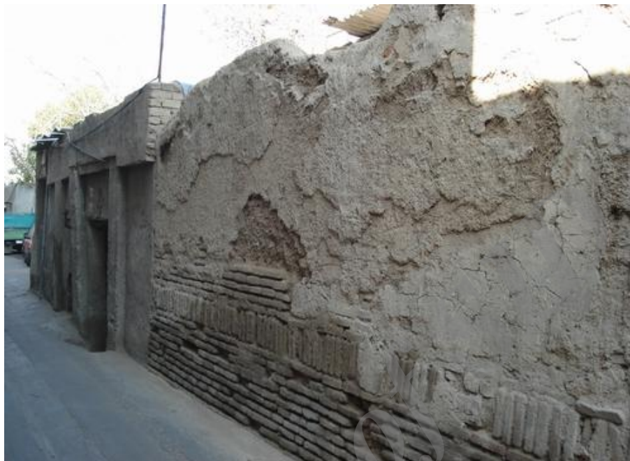
شکل ۶ معابری با بدنه ساده و خانه‌های طراحی‌شده (محل‌های عودلاجان و چال‌میدان)