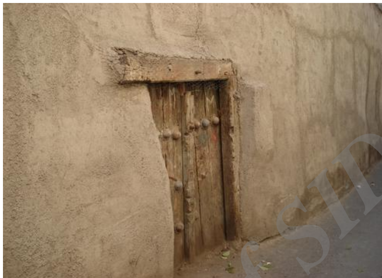
شکل ۴ معابری با بدنه ساده و خانه‌های طراحی نشده (محل‌های عودلاجان و چال میدان) (منبع: نگارندگان)