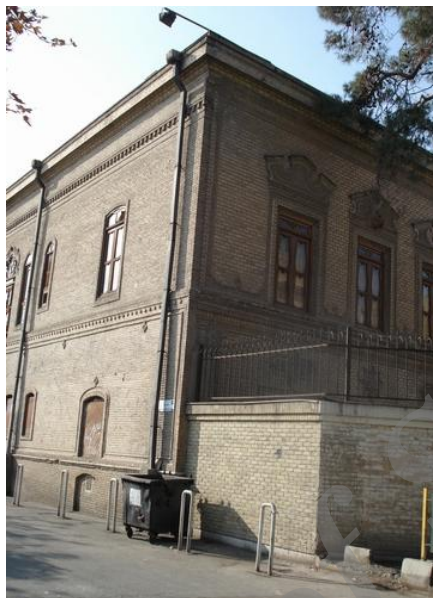
شکل ۱۳ نمایی از یک خانه دو طبقه با پنجره‌های رو به معبر (محلۀ دولت)