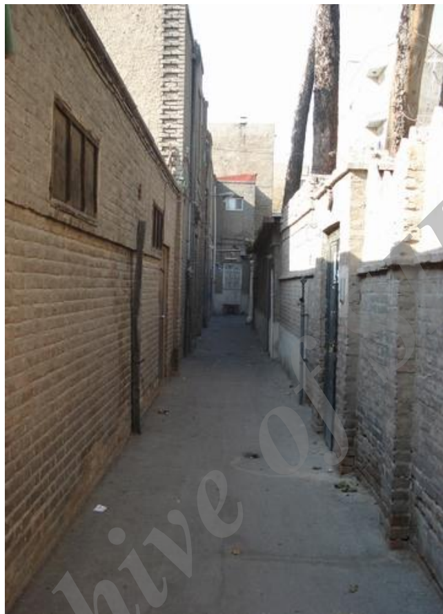
شکل ۹ نمایی از ورودی بسته خانه‌ها در یک کوچه دردار، شکل (محله سنگلج)