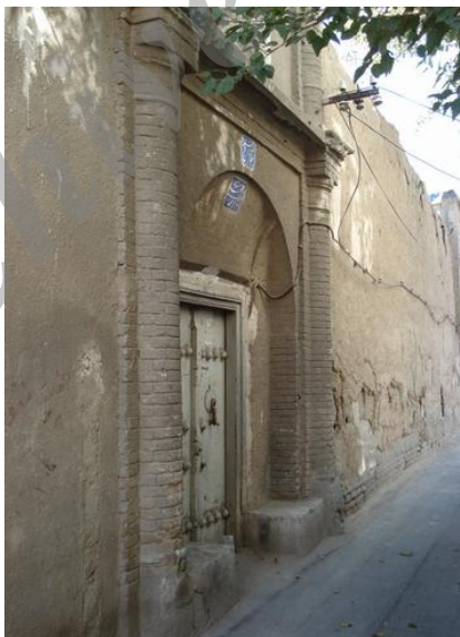
شکل ۳ معبری کم‌عرض با دیوارهای بلند که قنط نوك درختان حیاط از معبر دیده می‌شود (محلۀ عودلاجان)