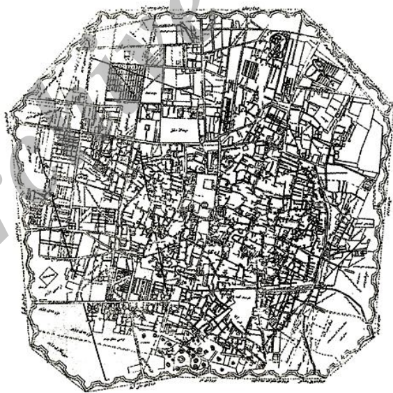
شکل ۱۱ تهران سال ۱۳۰۹ق براساس نقشه نجم‌الملک

توپچی‌ها و غلامان بودند (نوربخش، ۱۳۸۱: ۸۴۱)؛ بازار توسعه پیدا کرده و بخش مسکونی آن متراکم‌تر شده بود (اتحادیه، ۱۳۷۷: ۳۵)؛ سنگلج که اعیان و رجال آن را بزرگ‌ترین و بهترین محله برای سکونت می‌دانستند (همان، ۳۱) و ارگ که همچنان مکان زندگی خاندان حکومتی و اشراف بود. بخشی از فضای شمال‌غربی شهر را همین مجموعه بناهای سلطنتی و اداری ارگ دربرگرفته بود که خود دارای حصار جداگانه بود که تا دیوار شمالی شهر امتداد می‌یافت. در جنوب و تاحدی در شرق ارگ، مکان‌های خدماتی اصلی شهر از قبیل بناهای مذهبی، بازارها و کارگاه‌ها قرار داشت و محله‌های مسکونی هم اغلب در شمال‌شرقی و شمال‌غربی واقع شده بود (اسکرس، ۱۳۷۵: ۸۰). اما به تدریج اعیان و اشراف باغ‌ها و عمارت‌های بسیاری در خارج از حصار شهر (خارج از دروازه شمیران و دروازه دولت) برای خود ساختند و به مرور زمان، جمعیت افزایش یافت (سعیدنیا، ۱۳۷۶: ۲۸)؛ در نتیجه ناصرالدین‌شاه تصمیم گرفت تهران را گسترش دهد و برای این کار، الگوهای غربی را مد نظر قرار داد. نقشه عبدالغفار نجم‌الملک به سال ۱۳۰۹ق روند این گسترش را به‌خوبی نشان می‌دهد (شکل ۱۱).