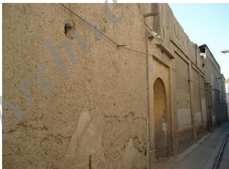
شکل ۵ معابری با بدنه ساده و خانه‌های طراحی نشده (محل‌های عودلاجان و چال میدان)