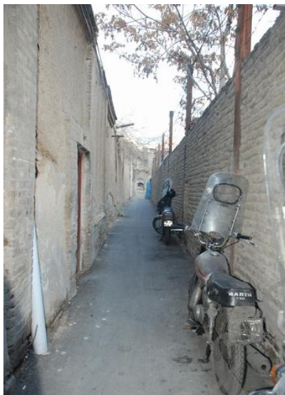
شکل ۲ معبری باریک و طویل که در انتها شکلی ماریج و خانه‌هایی درونگرا در طول خود دارد (محلۀ ارگ/ دولت) (منبع: نگارندگان)