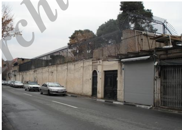
شکل ۱۲ معبری عریض و مستقیم با خانه‌های سبک غربی (محله دولت)

بدین ترتیب در اواخر دوره ناصرالدین‌شاه، برای بار دیگر دگرگونی‌هایی در تهران پدید آمد؛ به این صورت که علاوه بر محله‌های پنج‌گانه شهر، محله‌های جدیدی به‌نام دولت در شمال، قاجاریه در شرق، محمدیه در جنوب، قنات‌آباد در جنوب‌غربی و حسن‌آباد در غرب ساخته شد (اسکرس، ۱۳۷۵: ۸۶). بافت متراکم شهر، به‌ویژه در محله‌های شمالی و غربی شکلی منظم به خود گرفت؛ اما به محله‌های جنوبی و شرقی که محل سکونت افراد فقیر بود، کمتر توجه شد و بافت شهری آن‌ها نامنظم باقی ماند (قریب، ۱۳۷۴: ۲۱۳ و ۲۱۵). کوچه‌ها سنگ‌فرش شد، معابر قدیم شوسه شد و به سبک خیابان‌های نئوکلاسیک اروپا خیابان‌های جدیدی در تهران ساخته شد که مهم‌ترین شاخصه آن‌ها، عریض‌تر شدن و در نتیجه مستقیم شدن امتداد معابر بود (سلطان‌زاده، ۱۳۷۳: ۱۶؛ شکل ۱۲). این خیابان‌های عریض و مستقیم به‌عنوان مظهر شهرسازی جدید، جای کوچه‌ها و گذرهای ارتباطی بافت قدیم را گرفتند و بدون توجه به محیط سنتی و ویژگی‌های اقتصادی، فرهنگی، اجتماعی و کالبدی شهر، به مکانی رفت‌وآمد، دادوستد، کسب و کار و گردش تبدیل شدند.