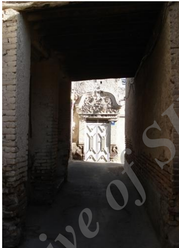
شکل ۷ بن‌بستی کم‌عرض و مسقف (محل بازار)