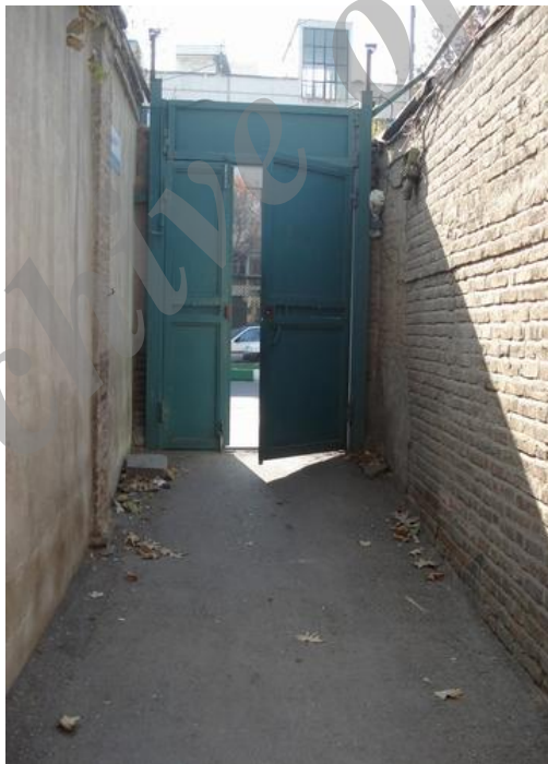
شکل ۸ نمایی از ورودی بسته خانه‌ها در یک کوچه دردار (محله سنگلج)

که نه توجه دیگران به آن جلب شود و نه تشخیص ماهیت معماری و فضاهای درونی خانه از داخل معبر به آسانی انجام گیرد (میرزایی، ۱۳۸۵: ۱۹۴؛ شکل ۴-۶). ورودی که معمولاً در نزدیکی یکی از گوشه‌های خانه قرار می‌گرفت، اغلب حالتی گشوده و باز به سوی معبر داشت و گاه فضایی بسته و اختصاصی بود؛ به این صورت که در ورودی دو یا چند خانه در یک محیط واحد مانند کوچه بن‌بست یا هشتی متصل به معبر قرار می‌گرفت و فضای واقع در ابتدای این کوچه یا هشتی به‌مثابه فضای ورودی خانه‌ها طراحی می‌شد و با یک در به لبه راه متصل می‌شد که به این فضای محصور و بسته کوچه دردار می‌گفتند (سلطان‌زاده، ۱۳۷۲: ۱۴۶ و ۱۷۴؛ شکل ۸ و ۹). درگاه خانه‌ها نیز معمولاً به‌صورتی بلند (۱/۵ متر با عمق حدود ۰/۵ متر) و کوتاه‌تر از سطوح مجاور خود بود و بسته به عرض کم معابر، عموماً در کنار معبر و در امتداد لبه معبر قرار می‌گرفت (سلطان‌زاده، ۱۳۷۱: ۱۲۸).