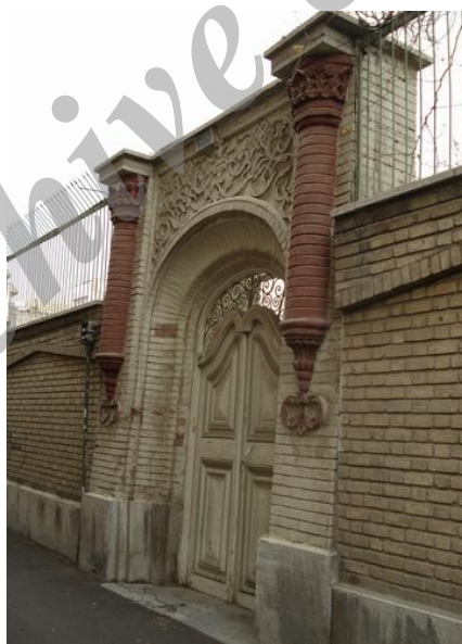
شکل ۱۴ معابر وسیع با دیوارهای کوتاه و فضاهای طراحی شده‌ی خانه‌ها در حواشی آن‌ها (محلۀ دولت)