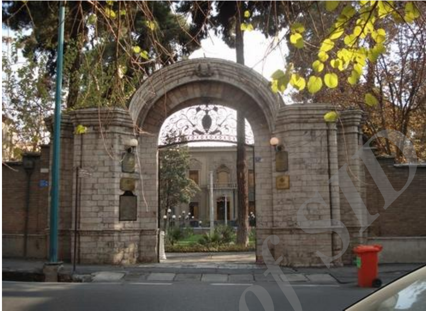
شکل ۱۵ معابر وسیع با دیوارهای کوتاه و فضاهای طراحی شده‌ی خانه‌ها در حواشی آن‌ها (محله دولت)