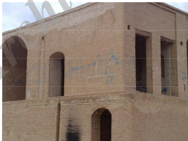
شکل ۳ ساختمان مجموعه گورهای زرتشتیان شهرستان یزد