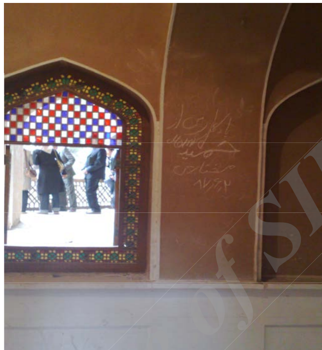
شکل ۲ اثر تاریخی: باغ دولت‌آباد شهرستان یزد