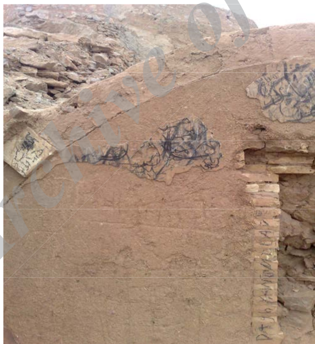
شکل ۱ اثر تاریخی: دخمه (گورهای زرتشتیان) شهرستان یزد

زبان لاتین است، مشاهده می‌شود و نزدیک به یک درصد هم به زبان‌های دیگری مثل عربی درج شده است. پس از حروف یا کلمات لاتین به ترتیب اصطلاحات رکیک و زنده، شکل‌ها و تصویرها (قلب، حیوانات و...)، نام شهر یا محل سکونت، اصطلاحات با مضمون شکایت از روزگار، واژه‌های عشق و دوستی، اشعار و ابیات، واژه‌های غم و تنهایی، سایر واژه‌ها مانند نام امزاده و...، شماره تلفن، اصطلاحات خاص جاهلی و لوطی‌گری، و اصطلاحات برگرفته از سریال‌های تلویزیونی قرار دارد. نکته حائز اهمیت درباره فراوانی واژه‌ها این است که برخی واژه‌ها در واقع ناشی از نبود زمینه لازم برای بروز خود نوجوان و جوانان است که در جای دیگری باید تجلی کند؛ ولی بر تارک و رخ بناهای تاریخی نمایان می‌شود که ضایعه‌ای سوزناک و جبران‌ناپذیر است. به‌منظور روشن شدن مقوله دیوارنویسی، تصویرهایی از دیوارنویسی بر مکان‌های تاریخی و باستانی شهرستان یزد آورده شده است: