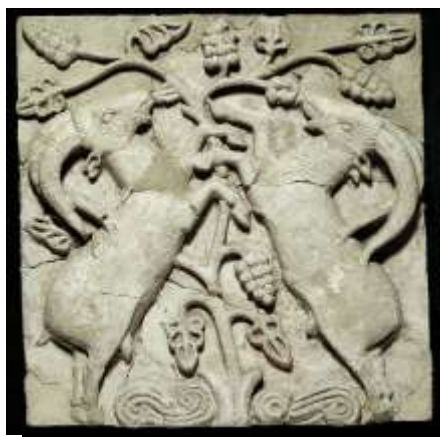
تصویر ۲: شوش، درخت زندگی

درخت انگور به‌منزله نمادی از خیر و برکت یکی از نقوش بسیار مهم دوره ساسانی است که تکرار آن در شوش، تپه‌میل و بیشاپور خود بر این اهمیت آن صحنه می‌گذارد و نشان می‌دهد، این نماد با توجه به مفهوم اعتقادی و مذهبی آن - که نمادی از برکت است - در صحنه معروف زندگی (شوش) با عنوان درخت زندگی آمده است. از دلایل به‌وجود آمدن نگاره درخت زندگی را می‌توان وجود حس فطری جاودانگی در ذات بشریت دانست که همواره در اندیشه یافتن راهی برای جاودانگی خویش بوده است. درخت شاید بدین دلیل به‌منزله نماد زندگی انتخاب شده که در طول تاریخ فواید و تأثیرات مهمی در زندگی بشر داشته و مورد توجه و احترام خاص انسان بوده است و از جهتی دیگر به‌دلیل طول عمر زیاد بسیاری از درختان و باروری و خیر برکت آن‌ها، درخت را به‌منزله نمادی از جاودانگی پذیرفته‌اند. درخت مقدس از جمله نقوشی است که تأکیدات مذهبی فراوانی پیرامون آن شده و حضور پررنگ این نقش در آثار هنری دوره ساسانی نشان از جایگاه مهم این نقش‌مایه دارد.