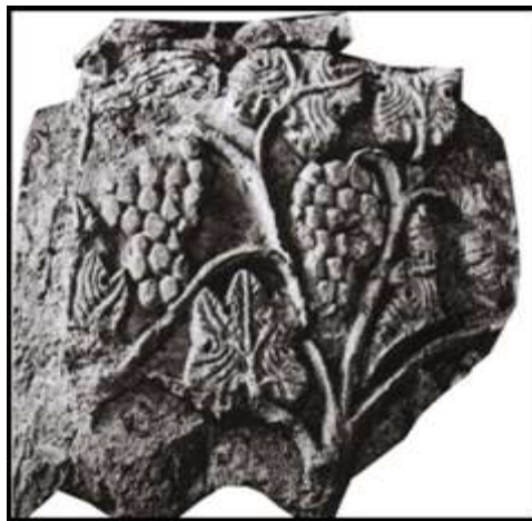
تصویر ۳: تپه‌میل، قطعه گچ‌بری با نقش انگور