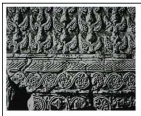
تصویر ۹: چال ترخان، لوح گچی با نقش انار (مأخذ: کولابادی، ۱۳۸۸: ۲۲۸)

انار دارای مفهومی جهانی است و همواره در بین ملل مختلف دارای اهمیتی خاص بوده است و بیشتر آن را نماد و نشانه‌ای از باروری دانسته‌اند و این گسترده بودن مفهوم انار سبب اشتراکات مفهومی و نمادی این میوه در بین ملل مختلف شده است. برای مثال، در یونان نمادی از آفرودیت و در ایران نمادی از آناهیتا است که هر دوی این الهگان نشان باروری و خیروبرکت هستند. از انار در اوستا نامی به میان نیامده و در متون پهلوی از جمله بندهش آن را میوه‌ای بهشتی دانسته‌اند. در پایان، گفتنی است، اهمیت انار به حدی است که در دوره اسلامی نیز جایگاه خود را از دست نداده و در «قرآن مجید (الرحمن/ آیه ۸) از انار به منزله میوه‌ای بهشتی یاد شده است.