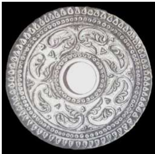
تصویر ۵: بیشاپور، لوح گچ‌بری برگ خرما