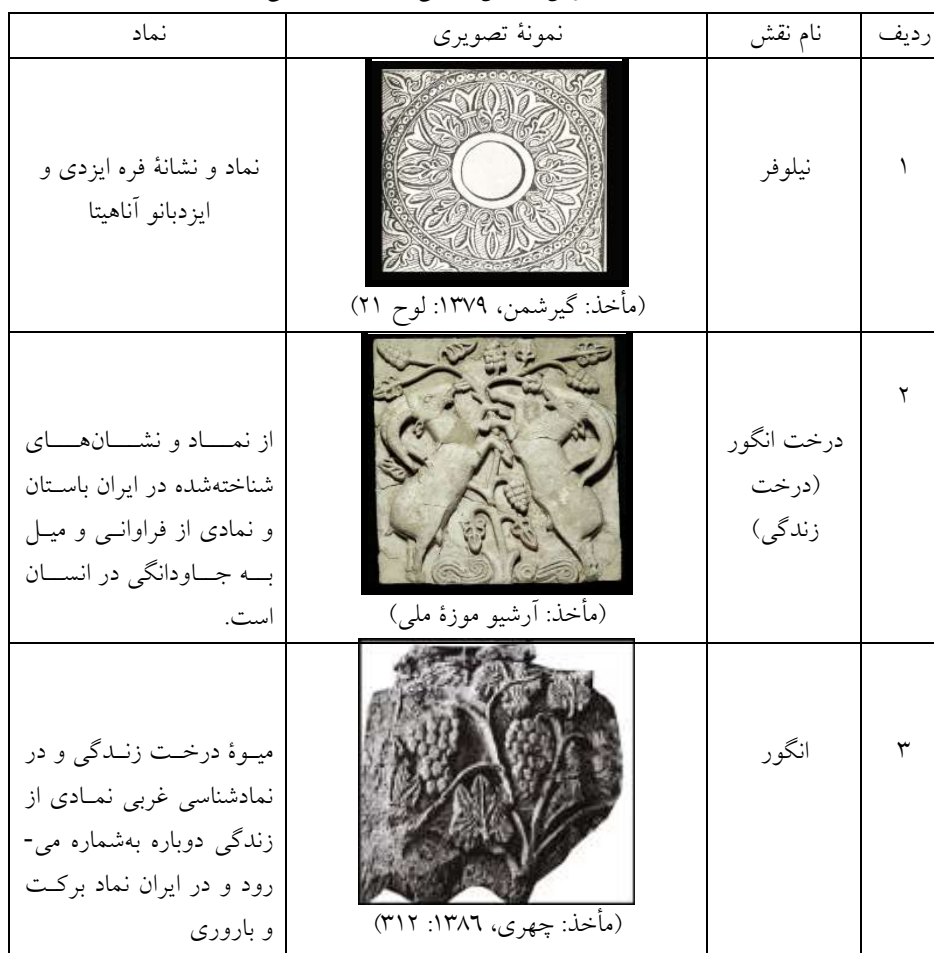
جدول ۱: نقوش نمادین گیاهی در دوره ساسانی

آناهیتا به‌منزله ایزد باروری بوده است. کلیت این نمادهای مورد بررسی، نشان می‌دهد، همه در چارچوب اعتقادات مذهبی و جهان‌بینی مذهبی ساسانیان قرار داشته‌اند و هدف از خلق آثار هنری نمادین و اساطیری در این دوره نشان دادن مذهب به‌منزله جزئی جدایی‌ناپذیر از حکومت سیاسی بوده است و همان‌طور که در نقش‌برجسته‌ها، سکه‌ها و ظروف نقره‌ای شاهان ساسانی همواره در مشروعیت‌بخشی کوشش می‌کردند، در خلق این نمادها نیز با بهره‌گیری از این عناصر در تلاش برای انعکاس اندیشه دینی خود و نشان دادن خط فکری مذهبی خود برای مشروعیت‌بخشی خود بوده‌اند.