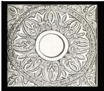
تصویر ۱: بیشاپور، قاب گچی با نقش نیلوفر

پژوهشی بر شاخص‌ترین نقوش نمادین گیاهی... ————— موسوی حاجی و همکاران