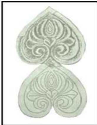
تصویر ۸: خارک، قطعه گچ‌بری برگ خرما

پژوهشی بر شاخص‌ترین نقوش نمادین گیاهی... ————— موسوی حاجی و همکاران