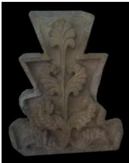
تصویر ۶: بیشاپور، کنگره گچی با نقش برگ خرما

نخل از جمله نقوش پیشینه‌دار و پرکاربرد در ایران و فرهنگ‌های همسایه (بین‌النهرین و مصر) بوده که نمادی از باروری و حیات است. همان‌گونه که اشاره شد، نخل در ایران باستان نماد برکت و کهن‌سالی محسوب می‌شود و ویژگی‌های درخت زندگی را داراست و همین باور ریشه‌دار در اندیشه ایرانیان سبب تداوم این نقش در طول دوران تاریخی شده است. اهمیت نخل و نمایش پررنگ آن در آثار هنری از جمله گچ‌بری را می‌توان نقش پررنگ مذهبی و کاربرد آن در مراسم مذهبی زرتشتیان دانست که جایگاه ویژه‌ای داشته است.