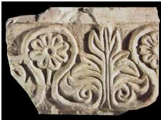
تصویر ۷: حاجی آباد، قطعه گچ‌بری با نقش برگ خرما.