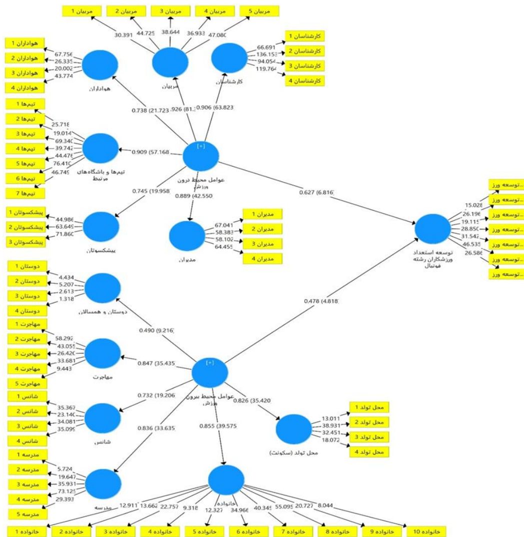
شکل ۲: مدل نهایی پژوهش (ضریب اثر و ضرایب معنی داری)

به منظور برازش مدل کلی (هر دو بخش مدل اندازه‌گیری و ساختاری) از معیار SRMR استفاده شد که مقدار آن باید از ۰/۱ کمتر باشد. با توجه به مقدار به دست آمده (SRMR=۰/۰۹)، مدل اندازه‌گیری و ساختاری از برازش مناسبی برخوردار است، یعنی در مجموع مدل اندازه‌گیری و ساختاری، کیفیت مناسبی در تبیین متغیر درون‌زا پژوهش دارد.