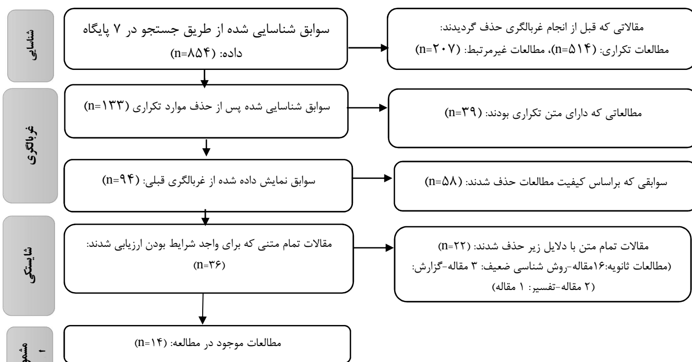
شکل ۲- نمودار PRISMA جهت بررسی‌های مرور نظام‌مند شامل جستجو در پایگاه‌های داده و سایر منابع

داده می‌شود. در این مطالعه نسخه ۲۰۱۸ چکلیست Batten مورد استفاده قرار گرفت و با توجه به این‌که چکلیست به تفکیک انواع مقالات / مطالعات می‌باشد در این روش به بررسی روایی و پایایی تحلیل کیفی در زمینه مقالات انتخاب شده اقدام گردید. جهت افزایش میزان دقت و کیفیت، مطالعات انتخاب شده از لحاظ (غربالگری عنوان، چکیده و متن کامل) توسط دو بازبین به‌طور مستقل انجام شد. هرگونه اختلاف بین بازبینان تا زمان توافق مورد بحث قرار گرفت. با وجود این، معیار اصلی جهت امتیاز ارزیابی کیفیت مقالات در موارد اختلافی استفاده از نرم‌افزار علم‌سنجی با عنوان Harzing's Publish or Perish بود که بر اساس شاخص‌های: h-index، g-index، hI-norm، hI-annual و hA-index مقالات اختلافی دو ارزیاب مورد تحلیل و ارزیابی قرار گرفته و جهت تصمیم و انتخاب نهایی در اختیار دو ارزیاب قرار می‌گرفت.