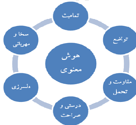
شکل ۱. مولفه‌های هوش معنوی از نظر نوبل و گان

افزایش کارایی و بهره‌وری در آنهاست ولی متأسفانه اغلب در جوامع فن‌آورانانه امروزی این مهم به دست فراموشی سپرده می‌شود. این واقعیت در مورد انسان و روابط انسانی وجود دارد که بایستی به انسانها به عنوان موجودات انسانی، نگریسته شود نه اشیایی برای رسیدن سازمان به اهداف خود. بنابراین اینکه افراد چگونه با هم یک رابطه خوب در درون سازمان داشته و چگونه با یکدیگر یک اجتماع را خلق کنند، مهم است (زوهر و مارشال، ۲۰۰۴؛ نقل در سیسک ۸ ، ۲۰۰۸). هوش معنوی، به عنوان یک سازه روانی- رفتاری، به افراد یاری می‌رساند تا به ارزیابی موقعیت کاری خود پرداخته و در خود نسبت به خود احساس دلسوزی داشته باشند این موضوع از آن جهت دارای اهمیت است که افراد دارای حس خود دلسوزی نسبت به دیگران نیز می‌توانند دلسوزی نشان دهد (مک‌مولن ۹ ، ۲۰۰۳). افراد حوزه‌های اجتماعی مختلف از جمله کتابداران می‌توانند با رشد مولفه‌های هوش معنوی (شکل شماره ۱) به شغل خود معنا و مفهوم بخشند (نوبل ۱۰ ، ۲۰۰۰).