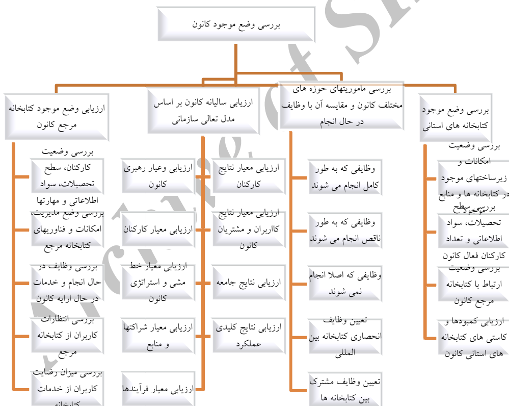
شکل ۳: بررسی وضع موجود قانون پرورش فکری کودکان