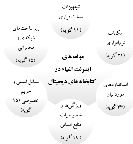
شکل ۲. مولفه‌ها و گویه‌های اصلی مورد نیاز

تجزیه و تحلیل، در مرحله چهارم، مبتنی بر خواندن و رمزگذاری کامل متن مقالات در نشریات منتخب است. همچنین در این مرحله، چند نشریه عمدتاً مستثنی بودند زیرا به نظر می‌رسد این مدارک تأکید متفاوتی نسبت به آنچه که در ابتداء و در چکیده مقاله آمده است، دارند. نمونه‌هایی مدارک مورد بررسی شامل ۴۴ رکورد اطلاعاتی (۲۴ مقاله ژورنالی، ۱۱ مقاله همایش و ۹ فصل از کتاب‌ها) است. در مرحله بعد، همه مقالات شناسایی شده در ابعاد مختلف طبقه‌بندی شدند. با این حال، در فرایند طبقه‌بندی، نویسندگان تغییرات را حذف کردند و مضامین ایجاد کردند تا تمامی کدهای شناسایی شده در این مطالعه را پوشش دهند. برای دستیابی به اجماع در مورد چگونگی تفسیر، برچسب‌گذاری و ساختاری مقالات استخراج شده، نویسندگان چندین جلسه ترتیب داده‌اند. در این جلسات، درک مشترک و تفاوت عقاید نویسندگان به طور گسترده مورد بحث قرار گرفت. در یک روش مشترک، نویسندگان تلاش کردند تا عوامل مختلفی را در ابعاد سطح بالاتر سازمان دهند. به طور تلویحی، ابعاد و عوامل زمینه‌سازی آن تنظیم و تجدید شکل می‌شوند تا اینکه تمام عوامل تحت پوشش قرار گیرند و نیازی به تعدیل بیشتر لازم نباشد. با الویت‌بندی به عمل آمده بر اساس فراوانی استفاده از کدها در منابع مختلف شش مولفه اصلی شناسایی شدند و بر اساس طبقه‌بندی‌ها و کد گذاری‌های فرعی یکصد و چهارده گویه به شرح شکل ۱ استخراج شدند.