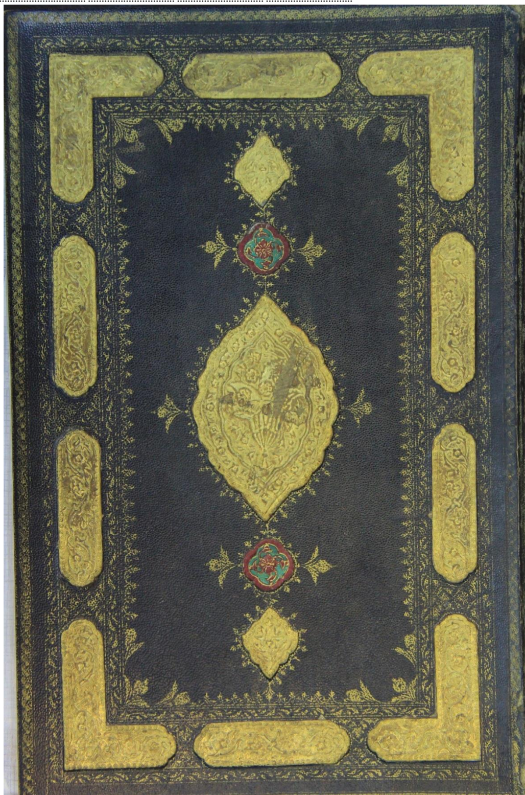
تصویر ۳. جلد سوخت وزر کوب نسخه خطی بنام خمسه نظامی به شماره ۹۸ کتابخانه مرکزی دانشگاه تهران.