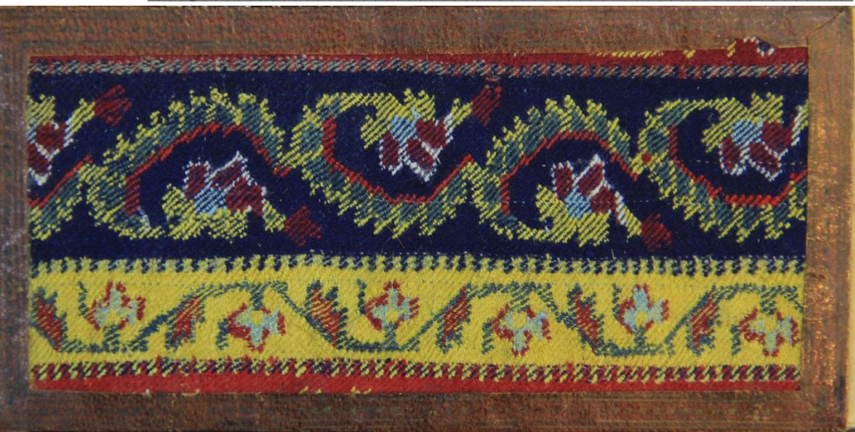
تصویر ۴: جلدیاض بارو کش پارچه ودور وعطف تبماج نسخه خطی به شماره ۱۱۱۸۳ کتابخانه مرکزی دانشگاه تهران.