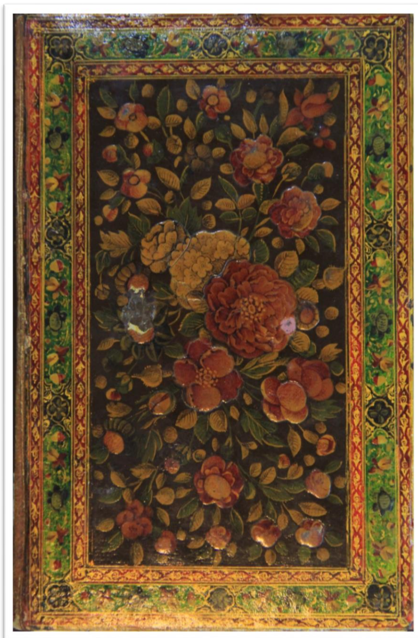
تصویر ۵: جلد روغنی گل و بوته نسخه خطی به نام قرآن به شماره ۴۹۳۱ کتابخانه مرکزی دانشگاه تهران