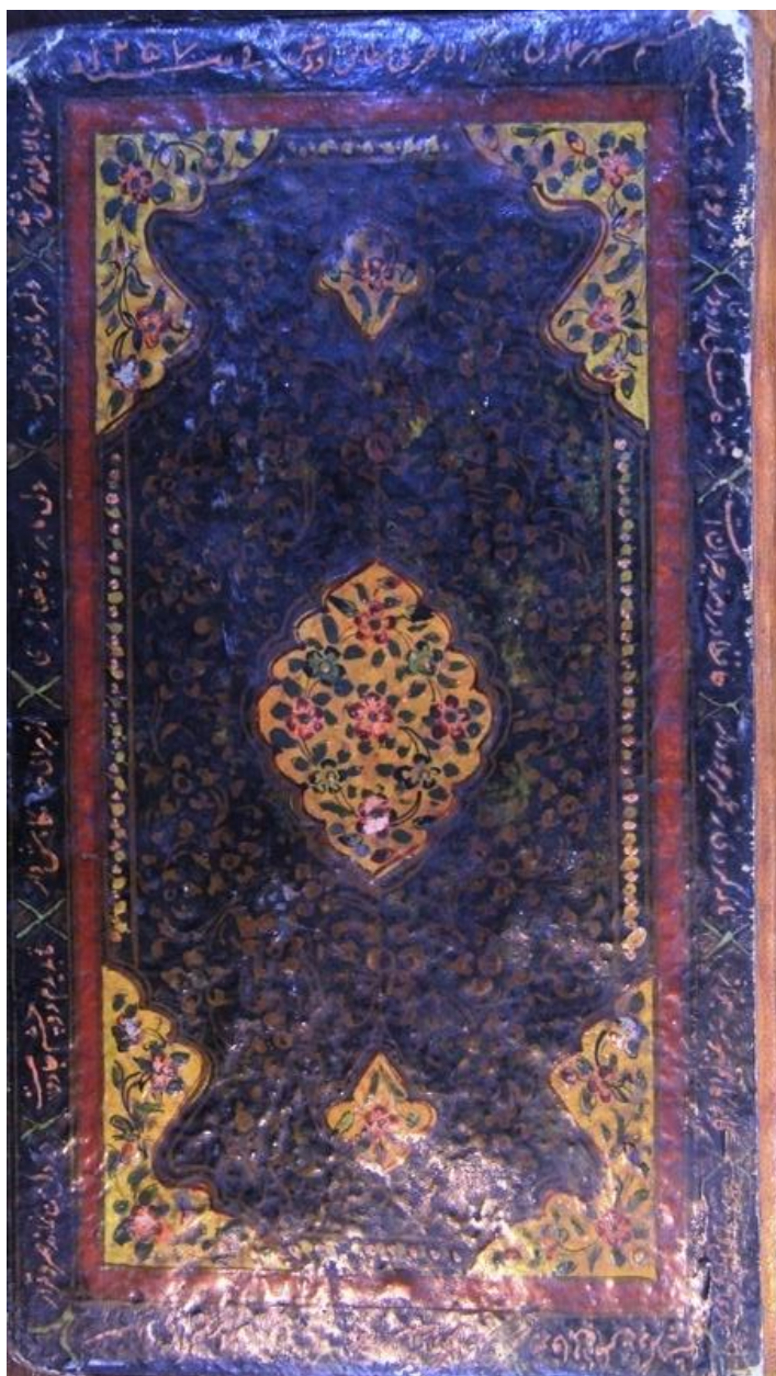
-تصویر ۱. خطی