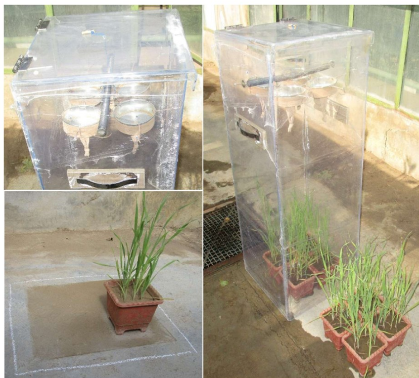
شکل ۱ - اتاقک طراحی شده برای ایجاد گرد و خاک بر روی اندام‌های هوایی یولاف وحشی زمستانه و نمایی از توزیع یکنواخت گرد و خاک بر روی سطح زمین به وسیله این اتاقک (فلش). ابعاد در متن ذکر شده است.

فلورفن، علف‌کشی غیریونی، پاراکوات، علف‌کشی کاتیونی و گلو فوسینات، علف‌کشی با خاصیت اسیدی ضعیف و با ضریب تفکیک اسیدی (pKa) برابر دو در دمای ۲۵ درجه سانتی‌گراد است. گلو فوسینات از جمله علف‌کش‌های بسیار حساس به حضور انواع کاتیون‌های موجود در آب سخت است (Devkota & Johnson, 2016). از آن‌جا که بار الکتریکی موجود بر روی ساختار مولکولی میکوات مثبت است (Rytwo & Tropp, 2001)، احتمالاً گلو فوسینات با میکوات در درون مخزن سمپاش، پیوند یونی ایجاد می‌کند که سبب کاهش جذب علف‌کش به وسیله علف‌هرز و نهایتاً کاهش کارایی آن می‌شود. در شرایط عدم حضور گرد و خاک بر