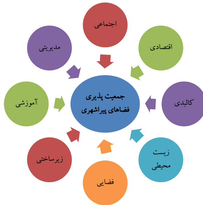
شکل ۱. مدل مفهومی پژوهش (عوامل مؤثر بر جمعیت پذیری فضاهای پیراشهری)

پژوهش حاضر است. با توجه به مطالب عنوان شده مدل مفهومی زیر را می توان برای علل مؤثر بر جمعیت پذیری فضاهای پیراشهری طراحی کرد (شکل ۱).