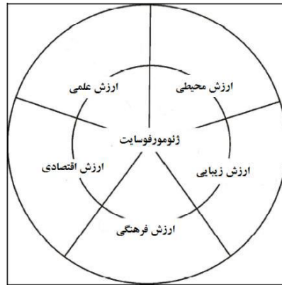
شکل ۱: ویژگی‌های ژئومورفوسایت‌ها (مأخذ: کومانسکو و دوبره، ۲۰۰۹)

ارزش‌های کلی ژئومورفوسایت‌ها در بررسی ابعاد مختلف آن‌ها به نقل از کومانسکو و دوبره (۲۰۰۹) در شکل ۱ خلاصه شده است.