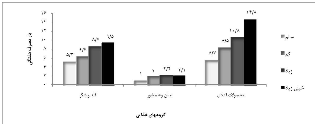
نمودار ۲- بار مصرف هفتگی گروه‌های غذایی با شدت پوسیدگی کل دندانها در کودکان ۶ تا ۱۱ ساله مراجعه کننده به مرکز بهداشت شمیرانات در سال ۱۳۸۸

مدل رگرسیون لجستیک متد فوروارد نشان داد کسانی که ۳/۵ بار و بیشتر از میان وعده عصر استفاده میکردند، شانس ابتلا به پوسیدگی دندان ۵ برابر بیشتر داشتند ( P < 0.05 ). کسانی که ۱ بار و بیشتر در روز مسواک می زدند به نسبت کسانی که مسواک نمی زدند یا نا مرتب می زدند، شانس ابتلا به پوسیدگی دندانشان ۷۰ درصد کاهش یافته بود ( P < 0.01 ). کسانی که خشکبار مصرف می کردند به نسبت کسانی که مصرف نمی کردند، شانس ابتلا به پوسیدگی دندانشان ۲ برابر بیشتر بود ( P < 0.05 ). مدل همبستگی اسپیرمن بین وضعیت مصرف گروههای غذایی و متغیرهای زمینه ای و تاثیر گذار با پوسیدگی کل دندانها (DMFT/dmft) نشان داد که همبستگی خطی مثبت بین بار مصرف میان وعده عصر، کل میان وعده ها در روز، گروه قند و شکر و گروه محصولات قنادی با پوسیدگی کل دندانها (DMFT/dmft) و همبستگی خطی منفی بین مسواک زدن در هفته، ۱ ماه و ۶ ماه گذشته و همچنین میزان تحصیلات مادر با پوسیدگی کل دندانها (DMFT/dmft) وجود دارد ( P < 0.01 ).