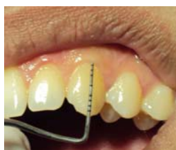
شکل ۳- لثه ضخیم

ضخامت لثه مارژینال توسط پروب ویلیامز و مشاهده سایه پروب صورت گرفت. بدین صورت که پروب در ناحیه مید باکال دندان مورد نظر وارد سالکوس لثه شد و اگر سایه پروب از روی لثه دیده می‌شد لثه نازک (شکل ۲) و اگر دیده نمی‌شد لثه ضخیم (شکل ۳) بود. (۱۵)