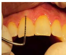
شکل ۲- لثه نازک

عمق پروبینگ نیز در مید باکال هر ۶ دندان توسط پروب ویلیامز اندازه گیری شد. مرحله بعدی بررسی فرم و اندازه تاج بود. ابتدا یک قالب آلژیناتی از فک بالای بیمار گرفته شد و کست آن توسط گچ استون ریخته شد. سپس طول تاج (CL)،