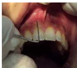
شکل ۱- اندازه گیری میزان لثه کراتینیز

اندازه‌گیری میزان لثه کراتینیزه توسط پروب ویلیامز از لثه مارژینال تا خط مخاطی لثه ای (Mucogingival Junction)(MGJ) انجام پذیرفت. (شکل ۱)