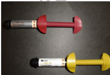
شکل ۱- کامپوزیت های Z250 و Filtek p90

تعداد نمونه‌ها براساس مطالعات مشابه برآورد شد. (۳،۴) سپس از لحاظ وزنی با استفاده از ترازوی دقیق دیجیتالی همسان سازی شدند و مطابق دستور سازنده با دستگاه لایت کیور LED Turbo (Apoza, Japan) با شدت اشعه ۹۵۰ میلی وات بر سانتی متر مربع به مدت ۲۰ ثانیه از سطح فوقانی کیور شدند، به طوریکه زیر قالب یک صفحه مشکی جاذب نور قرار داده شد تا از انعکاس نور جلوگیری کند. قبل از انجام آزمون DSC، نمونه‌ها درون محفظه‌های در بسته تیره منیزی می به دور از نور خورشید در دمای اتاق نگهداری شدند. نمونه‌ها با دستگاه (Perkin Elmer, Norwalk, CT, USA) DSC مورد بررسی قرار گرفتند. حرارت دستگاه تا ۲۸۰ و ۳۵۰ درجه سانتی گراد افزایش یافت و پیکهای حرارتی موجود در آن اندازه گیری شد. بر اساس اختلاف پیکهای ایجاد شده در طیف کامپیوتری و مقایسه آن با طیف استاندارد، میزان حرارت ناشی از پلیمریزاسیون نمونه‌های باقیمانده اندازه گیری شد. (۶) با توجه تبعیت داده‌ها از توزیع نرمال با استفاده از آزمون One-sample Kolmogorov-Smirnov برای error term مورد تأیید قرار گرفت ( P < 0.05 ). همچنین فرض یکسانی واریانسها در دو گروه با استفاده از Leven's Test تأیید شد ( P = 0.842 ). بنابراین جهت مقایسه میزان (DOC) (Degree of Conversion) در دو گروه مورد مطالعه از آزمون من ویتنی استفاده شد.