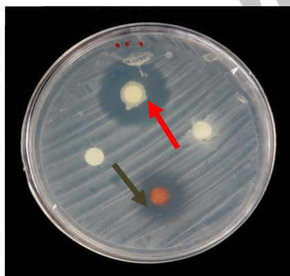
شکل ۳- مقایسه هاله‌ی عدم رشد دارچین (فلش سبز) با نیستاتین (فلش قرمز)

مربوط به عصاره ی آویشن به میزان (0.82 \pm 13) بود. آزمون ANOVA نشان داد که تفاوت در مهار کاندیدا از لحاظ آماری معنی دار بود. (P < 0.001)