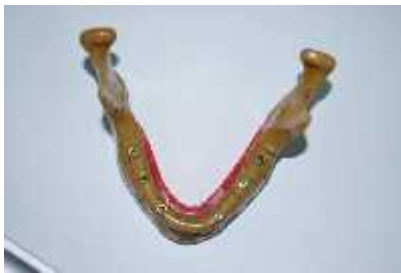
شکل ۱- Implant Drilling Model مورد استفاده در مطالعه

این مطالعه از نوع توصیفی بوده و به منظور انجام آن از مجموعه خشک انسان (dry skull) استفاده شد. (۱) از آنجاییکه هدف ما بررسی آرتیفکتهای ناشی از سخت شدن پرتو در ایمپلنتهای دندانی بدون تداخل با هیچ ماده دیگری بود، از Implant Drilling Model [IMP 1003-L-HD] ساخت ژاپن که کاملاً مشابه مندیبل واقعی انسان است به جای فک تحتانی استفاده شد. (شکل ۱)