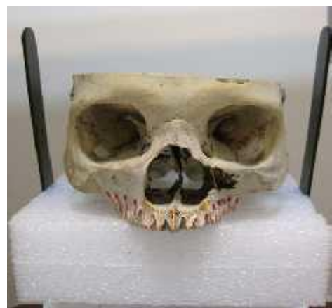
شکل ۱ - نمونه علامت گذاری شده با گوتا پرکا

این مطالعه از نوع توصیفی بود که در آن از ۳ مجموعه خشک انسانی استفاده گردید و در هر یک از مجموعه ها تعداد ۷ ناحیه راست و چپ ( mid palatal suture ) به فاصله ۵ میلی متری از یکدیگر در ناحیه دندان های کانین تا کانین توسط گوتاپرکا علامت گذاری شدند. ( شکل ۱ )