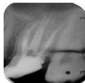
شکل ۳-ب - دو کانال پالاتال به وضوح در شکل دیده می شود