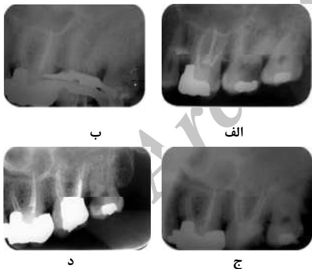
شکل ۲- رادیوگرافیهای اولیه (الف)، حین کار (ب)، پایان کار (ج) و پی گیری ۲۲ ماهه بیمار پس از درمان ریشه (د)

طول کارکرد توسط دستگاه اپکس لاکیتور (Root ZX; Morita, Tokyo, Japan) تعیین و سپس توسط رادیوگرافی تأیید شد. پاکسازی و شکل دهی کانالها با استفاده از فایل‌های دستی k و تکنیک Step back به انجام رسید و از هیپوکلریت سدیم ۱ درصد بعنوان محلول شستشو استفاده شد. در نهایت کانالها با گوتاپرکا و سیلر AH26 (Dentsply De Trey, Konstanz, Germany) و تکنیک lateral Condensation پر شدند (شکل ۲-ج). رادیوگرافی پی گیری ۲۲ ماهه بیمار تهیه شد و نشان دهنده درمان مناسب و عدم وجود ضایعه بدنبال درمان بود. (شکل ۲-د)