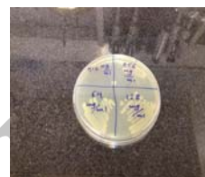
شکل ۲- کشت میکروبی پس از ۲۴ ساعت انکوباسیون در دمای ۳۷ درجه سانتی گراد

مشاهده پلیت های کشت داده شده نشان داد در تمامی غلظت های عصاره ی بابونه به جز غلظت ۵۱۲ میلی گرم بر میلی لیتر میکرو ارگانیسم رشد یافته است. همچنین مشاهده ی پلیت های حاوی غلظت های مختلف گروه شاهد اتانولی نشان داد قارچ ها در تمامی غلظت ها به جز اتانول ۷۰ درجه رشد یافته بودند و تنها اتانول رقیق نشده دارای اثر کشندگی بر روی قارچ کاندیدا آلبیکنس بود پس MFC معادل الکل ۷۰ درجه بود.