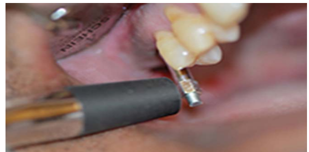
شکل ۲- اندازه‌گیری ثبات اولیه توسط دستگاه Osstell ISQ

سپس پروب دستگاه برای ثبت ISQ در فاصله ۱ تا ۳ میلی متری Smart Peg و ۳ میلی متر بالاتر از بافت نرم و با زاویه ۹۰ درجه نسبت به Smart Peg قرار می‌گرفت RFA. برای هر ایمپلنت دو بار و با دو زاویه مختلف اندازه‌گیری شد. یکی عمود بر کمرست استخوان و دیگری پارالل با خط کمرست (شکل ۲).