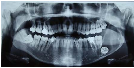
شکل ۵- نمای OPG در پیگیری سه ماهه

۸ داده شد. پس از گذشت ۹ ماه از جراحی اول جراحی دوم برای حذف کامل ضایعه انجام شد.