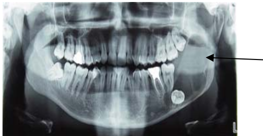
شکل ۳- ضایعه رادیوسنت مولتی لاکولر با مورد مشخص دیده می شود (فلش)

در بررسی OPG یک ضایعه رادیولوسنت مولتی لاکولار با حدود مشخص و بورد اسکروتیک از محذات سیگموئید ناچ تا ریشه میزالی دندان ۶ مندیبل سمت چپ دیده می شود. دندان ۸ در داخل ضایعه و به صورت نهفته باقیمانده و به سمت بوردر تحتانی مندیبل وزیر ریشه دندان ۷ جابجا شده است. (شکل ۳)