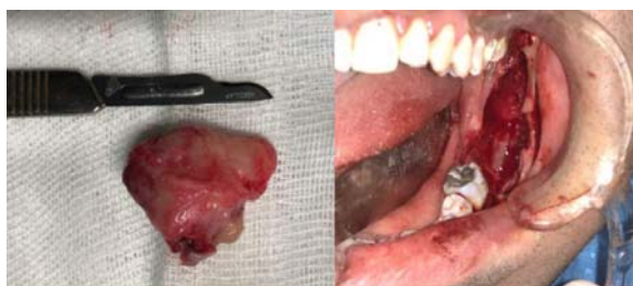
شکل ۷- مراحل جراحی را نشان می دهد

در جراحی مرحله دوم انوکلیشن کامل کیست بصورت یکپارچه انجام شد دندان ۸ نیز به همراه ضایعه خارج گردید و کورتاژ و پریفرال آستکتومی پس از staining با متیلن بلو انجام گرفت. عصب Inf Alveolar و بوردر تحتانی مندیبل حفظ شد. پس از اتمام پروسیجر جراحی و قبل از سوچورینگ از مش حاوی پماد موضعی 5-Fluorouracil (5FU) برای کاهش عود کیست در ناحیه استفاده شد و پس از ۲۴ ساعت مش مذکور خارج گردید. (شکل ۷)