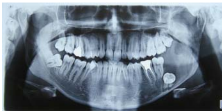
شکل ۶- نمای OPG در پیگیری ۶ ماهه

در جراحی مرحله دوم انوکلیشن کامل کیست بصورت یکپارچه انجام شد دندان ۸ نیز به همراه ضایعه خارج گردید و کورتاژ و پریفرال آستکتومی پس از staining با متیلن بلو انجام گرفت. عصب Inf Alveolar و بوردر تحتانی مندیبل حفظ شد. پس از اتمام پروسیجر جراحی و قبل از سوچورینگ از مش حاوی پماد موضعی 5-Fluorouracil (5FU) برای کاهش عود کیست در ناحیه استفاده شد و پس از ۲۴ ساعت مش مذکور خارج گردید. (شکل ۷)