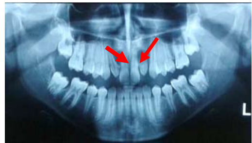
شکل ۲- نمای ضایعه در رادیوگرافی پانورامیک

در ارزیابی های رادیوگرافیک، (پانورامیک)، در هر دو سمت شاهد ضایعه ای با حدود مشخص، بوردرهای کورتیکه و تک حفره ای بودیم که در ناحیه سمت راست قدام ماگزینا تاج و یک سوم سرویکال ریشه دندان ۱۲ # را در بر گرفته و موجب جا به جایی دندانهای ۱۲ # و ۱۳ # به سمت دیستال شده بود.