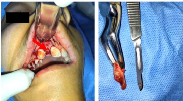
شکل ۴- انوکلیشن ضایعات به همراه خارج سازی دندانهای درگیر

در بایوپسی اکسیژنال صورت گرفته که شامل انوکلیشن ضایعات در هر دو سمت به همراه خارج سازی دندانهای ۱۲ # و ۲۱ # و کورتاژ بود، تکه های کاهی و قهوه ای رنگ بافت سخت قابل رویت بود. بر اساس یافته های کلینیکال و رادیوگرافی موجود، تشخیصهای ابتدایی مطرح شده، کیست ادونتوژنیک اپیتلیالی کلسیفیه، کیست دانتی ژور، تومور ادونتوژنیک اپیتلیالی کلسیفیه و آدنوماتوئید ادونتوژنیک تومور بودند. بررسی های میکروسکوپی آدنوماتوئید ادونتوژنیک تومور را تایید نمود. (شکل ۵)