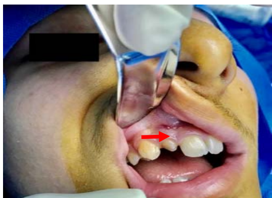
شکل ۱- نمای داخل دهانی ضایعه

در ارزیابی داخل دهانی تورم در ناحیه باکال دندانهای قدامی سمت راست ماگزایلا با ابعادی در حدود 3/1 \times 1 سانتی متر قابل رویت بود که در بعد مدیولترال، از مزایال دندان لترال اینسایزور تا مزایال دندان کانین و در بعد اکلوژوجینجیوال، از وستیبول باکال تا لثه چسبنده دندانهای کانین و لترال اینسایزور گسترش یافته بود. (شکل ۱)