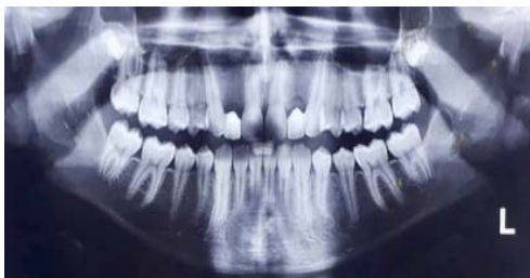
شکل ۶- رادیوگرافی پانورامیک یک سال پس از خارج سازی ضایعات

دندانهای ۲۲ # و ۲۳ # گسترش پیدا کرده بود. قوام هر دو ضایعه در لمس سفت و غیر قابل فشرده سازی بود و بیمار اندکی تندرnis را در لمس ابراز میکرد.