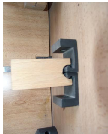
شکل ۴- نمونه‌های برش موازی الیاف و شکاف خوری