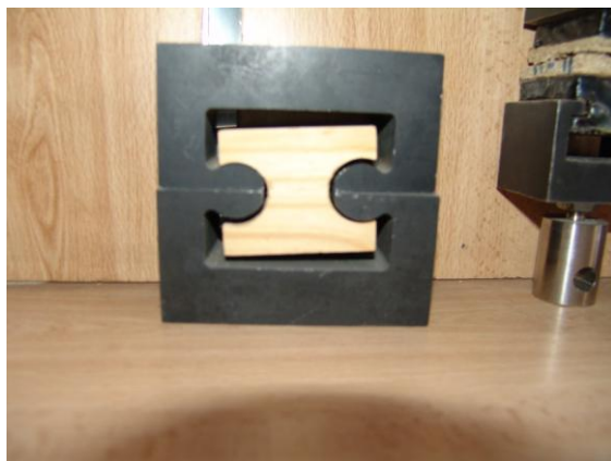
شکل ۳- نمونه آزمایش کشش موازی الیاف و مقاومت به خروج میخ