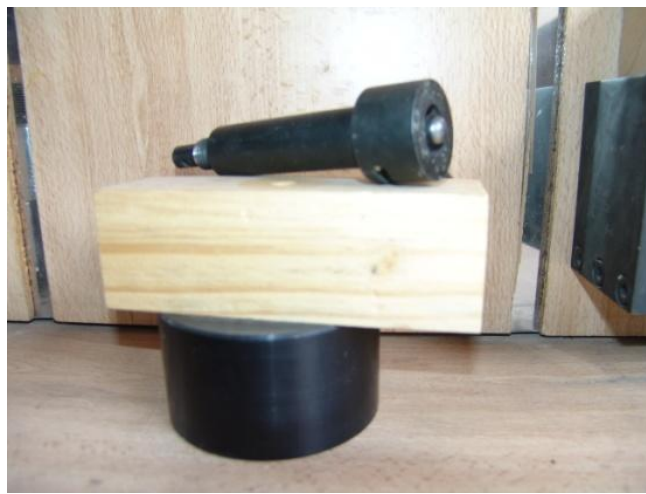
شکل ۵- نمونه مقاومت به ضربه

با بررسی تغییرات مقاومت خمشی در شکل ۶ در کل افرا پلت ایران نسبت به گونه افرا قندی، سیاه و قرمز مقاومت به خمش کمتر و نسبت به افرا نقره‌ای از مقاومت بیشتری برخوردار است.