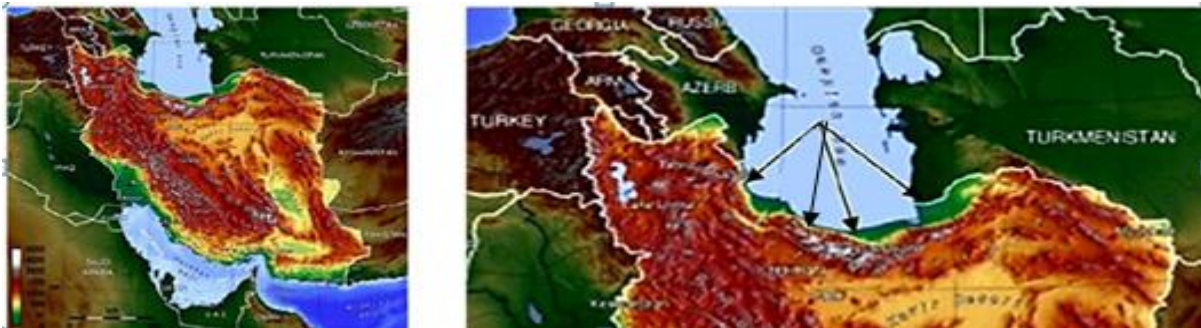
شکل ۱- نقشه ایران و مناطق رویشگاهی که نمونه‌گیری در این مناطق انجام شده است

گردید در ضمن انجام آزمایش‌های خواص مکانیکی در آزمایشگاه مکانیک چوب و فرآورده‌های آن با استفاده از دستگاه اندازه‌گیر مقاومت مکانیکی اینسترون مدل ۱۱۸۶ و همچنین دستگاه اندازه‌گیر مقاومت به ضربه اینسترون مدل PW5 با استاندارد ASTM D142-92 انجام شد و نمونه‌های خشک نیز بعد از رسیدن به رطوبت مناسب به ابعاد و اشکال نمونه آزمونی تبدیل و مورد آزمایش قرار گرفتند. نتایج آزمایش‌های با استفاده از نرم‌افزار MSTATC و طرح فاکتوریل مورد آنالیز قرار گرفته و با استفاده از گروه‌بندی دانکن گروه‌بندی شدند.