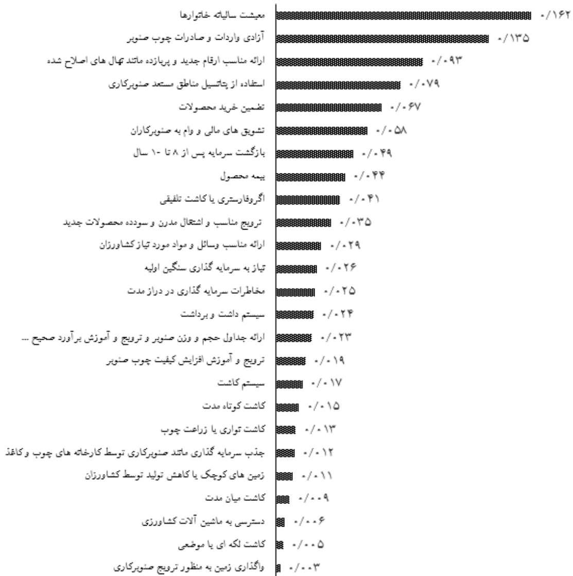
نرخ ناسازگاری کلی = ۰/۰۴

شکل ۲- میانگین هندسی ماتریس‌های مقایسه‌ای برای شاخص‌های اصلی نسبت به هدف مطالعه (سطح اول)