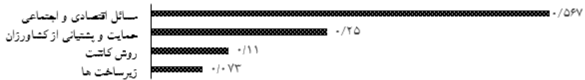
نرخ ناسازگاری کلی = ۰/۰۶

شکل ۲- میانگین هندسی ماتریس‌های مقایسه‌ای برای شاخص‌های اصلی نسبت به هدف مطالعه (سطح اول)