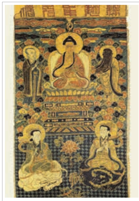
■ تصویر ۶: تانگ کا، بودای ساکیامونی به همراه منجوسری و سامانتا‌بهادر، قرن ۱۵ تا ۱۷ میلادی، ارتفاع ۶۹ سانتی متر

این آثار بودایی بر روی ابریشم تاکنون مربوط به دوره تانگ بودند؛ در اینجا دو نمونه از آثار بودایی را بر روی ابریشم در سلسله مینگ بررسی می‌کنیم. «گلیم بافته ۳۳ و قلاب‌دوزی‌های تانگ ۳۳ کا یا تصاویر بودا، در سلسله یوآن هم استفاده می‌شده است ولی در سلسله مینگ بهتر شناخته شده است و شامل تکه‌های با شکوهی از اوایل قرن پانزدهم میلادی می‌باشد. در طول سلسله مینگ طلا و زری بافی‌های پلی کرمی و قلاب دوزی برای تصاویر بودا استفاده می‌شده است که اغلب به نوبت بر روی زری‌دوزی‌ها و ساتن‌ها نصب می‌شد.» (همان منبع، ۱۴۹) در تصویر (۶)، «تانگ کا، بودای ساکیامونی که از دو طرف به وسیله منجوسری ۳۴ و سامانتا‌بهادر ۳۵ حفظ شده است، کشیده شده که به شیوه شماره دوزی دوخته شده است. کتیبه در بالای تصویر نوشته است: بودای ساکیامونی.» (همان، ۱۵۰) در این تصویر ترکیبی از رنگ قرمز و آبی غالب می‌باشد. بودا در حالت نشسته بوده و دو بودیساتوا بر روی شیر و فیل قرار گرفته‌اند و در میان آن‌ها گل لوتوس نیز بافته شده است. در اینجا ترکیبی از نقوش هندسی و غیرهندسی مشاهده می‌گردد.