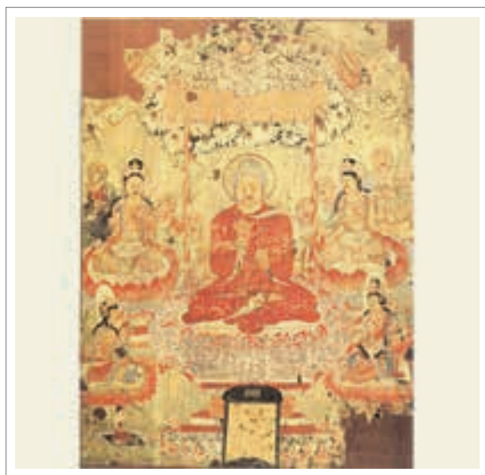
■ تصویر ۱. بودا آیین را فرا می‌آموزد، از غار ۱۷ دون هوانگ، اوایل قرن ۸، مرکب و رنگ روی ابریشم، ارتفاع ۱۳۹ سانتی‌متر

روی ابریشم است که بودا را در حالت موعظه تصویر می‌کند و مربوط به سلسله تانگ می‌باشد. «نقاشی، بودا را در حالت موعظه در زیر سایبانی تزئین شده نمایش می‌دهد. او در زیر درخت بودی ۲۳ نشسته است جایی که ساکیامونی ۲۴، بودای تاریخی، هنگامی که به روشنگری رسید نشسته بود.» (Michaelson & Portal, 2006, 37) در اینجا چهار بودیساتوا در اطراف بودا بر روی گل‌های لوتوس (نیلوفر) ۲۵ نشسته‌اند؛ شش رهرو نیز در آنجا مشاهده می‌شوند. در قسمت پایین «یک پیشکش آورنده زن دیده می‌شود که نقش همتای مرد او در سمت راست پاک شده و از آن فقط کلاهی بجا مانده است.» (فیشر، ۱۳۸۳، ۱۲۴) «قسمت عمودی پایین نقاشی هم با نام پیشکش آورندگان پر می‌شده اما در اینجا خالی است.» (Michaelson & Portal, 2006, 37) تصویر با سایه روشن‌های زیبا آراسته شده و رنگ قرمز تیره و روشن غالب است و این سایه پردازی‌ها به بعد تصویر افزوده‌اند. ابریشم ابتدا بر روی دستگاه بافندگی بافته شده و پس از آن، نقاشی با قلم مو و مرکب و رنگ بر روی آن صورت گرفته است و این پرده زیبا خلق شده است.