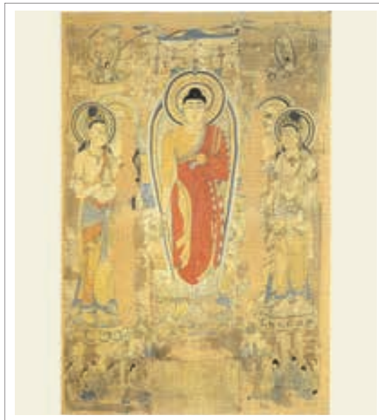
■ تصویر ۳: ساکیامونی آیین را در کوه کرکس فرا می‌آموزد. از غار دون هوانگ، سلسله تانگ، قرن ۸ میلادی، قلاب‌دوزی روی ابریشم

«در اینجا یکی از دو شیر کوچک ولی درنده خو از بودا محافظت می‌کنند. حیوان شیر در چین وجود ندارد به همین علت هنرمند نمی‌توانسته از زندگی خودش آن را کشیده باشد ولی این جانور در خاور نزدیک (هندوستان) به عنوان نمادی از قدرت و توانایی مشهور بوده است و بنابراین به عنوان نمادی از قدرت مذهبی هم پذیرفته شده است. از قرن سوم میلادی، شیر در مفاهیم بودایی استفاده شده است و پیکره‌های بودا در معابد بزرگ غاری در شمال چین اغلب نشسته بر روی تخت شاهی و دو شیر در دو طرف کنده کاری شده است. از این سنت، شیرهای کوچک محافظ نتیجه می‌شود که مانند این پرده ابریشمی، پیکره‌های بودا را همراهی می‌کنند.» (همان منبع، ۴۴) در پایین در کنار پیکره‌ها، خطوطی نوشته شده مشاهده می‌شود که «نشان می‌دهد چه کسی برای پرده قلاب‌دوزی شده، هزینه کرده است.» (Vainker, 2004, 102)