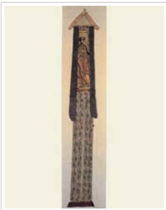
■ تصویر ۵: پرچم ابریشمی، اواخر قرن ۹ میلادی، ارتفاع ۱۷۲ سانتی متر

در تصویر (۵)، پرچمی ابریشمی را مشاهده می‌کنید که احتمالاً در معابد قرار داده می‌شده است. «به طور کلی هنر معبد در چین عمدتاً بودایی بوده است.» (همان منبع، ۳۲) «بر روی این پرچم، بودیساتوایی به تصویر کشیده شده است که یک کاسه شیشه‌ای حاوی گل لوتوس در دست دارد. نقاشی بر روی ابریشمی نازک کشیده شده است که تصویر آن از دو طرف قابل مشاهده می‌باشد. نوارهای آویخته پایینی هم نقاشی شده‌اند. در اینجا ابریشم به عنوان پشتیبانی برای تزیین استفاده شده تا بافتهای تزیینی.» (همان منبع، ۱۰۱)