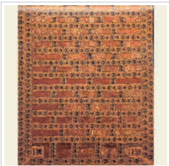
■ تصویر ۷: ردای کاهنان بودایی، اواخر قرن ۱۵، عرض ۳۰۹ سانتی متر، ارتفاع ۱۱۲ سانتی متر

این آثار بودایی بر روی ابریشم تاکنون مربوط به دوره تانگ بودند؛ در اینجا دو نمونه از آثار بودایی را بر روی ابریشم در سلسله مینگ بررسی می‌کنیم. «گلیم بافته ۳۳ و قلاب‌دوزی‌های تانگ ۳۳ کا یا تصاویر بودا، در سلسله یوآن هم استفاده می‌شده است ولی در سلسله مینگ بهتر شناخته شده است و شامل تکه‌های با شکوهی از اوایل قرن پانزدهم میلادی می‌باشد. در طول سلسله مینگ طلا و زری بافی‌های پلی کرمی و قلاب دوزی برای تصاویر بودا استفاده می‌شده است که اغلب به نوبت بر روی زری‌دوزی‌ها و ساتن‌ها نصب می‌شد.» (همان منبع، ۱۴۹) در تصویر (۶)، «تانگ کا، بودای ساکیامونی که از دو طرف به وسیله منجوسری ۳۴ و سامانتا‌بهادر ۳۵ حفظ شده است، کشیده شده که به شیوه شماره دوزی دوخته شده است. کتیبه در بالای تصویر نوشته است: بودای ساکیامونی.» (همان، ۱۵۰) در این تصویر ترکیبی از رنگ قرمز و آبی غالب می‌باشد. بودا در حالت نشسته بوده و دو بودیساتوا بر روی شیر و فیل قرار گرفته‌اند و در میان آن‌ها گل لوتوس نیز بافته شده است. در اینجا ترکیبی از نقوش هندسی و غیرهندسی مشاهده می‌گردد.