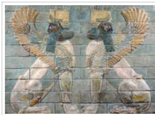
تصویر ۸: نقش برجسته اسفنگس، آجرهای لعابدار شوش، دوره هخامنشی.

این اسفنگس ها مرکب خدایان در طی مراسم آیینی بودند. در نقش برجسته های هخامنشی تصویر مبارزه پادشاه با شیر که نماد قدرت پادشاه است نشان داده شده. اما در هند تصویر جدال انسان با شیر مشاهده نمی‌شود. در هند الهه دورگا سوار بر شیر با دیوگاو میش می‌جنگد که مبارزه خدای نظم علیه دیو بی نظمی و در تخت جمشید نیز شیر در جدال با گاو مشاهده می‌شود که مبارزه خیر و شر و نماد غلبه گرما بر سرما و آغاز بهار است با این تفاوت که در هنر هند، شیر مرکب الهه دورگا و نماد خوبی به مبارزه با دیوگاو میش می‌رود اما در تخت جمشید شیر نماد خورشید و روشنایی مستقیماً با گاو نماد ماه و تاریکی مبارزه می‌کند که به تعبیر دیگر این نبرد نماد آغاز سال نو نیز می‌باشد. (تصویر ۳ را با ۵ مقایسه کنید)