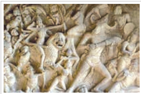
تصویر ۵: نقش برجسته نبرد الهه دورگا با دیو امیش، معبدی در مامالاپورام، هند