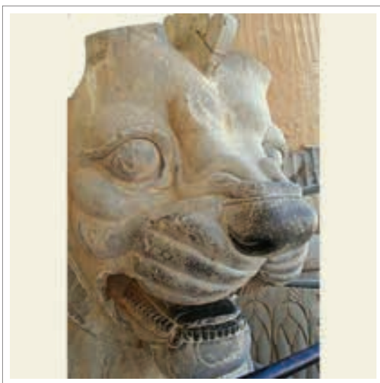
تصویر ۲: سر شیر، تخت جمشید، دوره هخامنشی

با مسائل دنیوی سروکار داشتند بعدها دو تیرگی میان آریان‌ها حاصل شد، بدین معنی که، ارباب انواع خوب و خیر هندی مبعوض آریان‌های ایرانی شده و به عکس ارباب انواع بد هندیان مقبول ایرانیان شد. (دادور-منصوری، ۱۳۸۵، ۴۵)