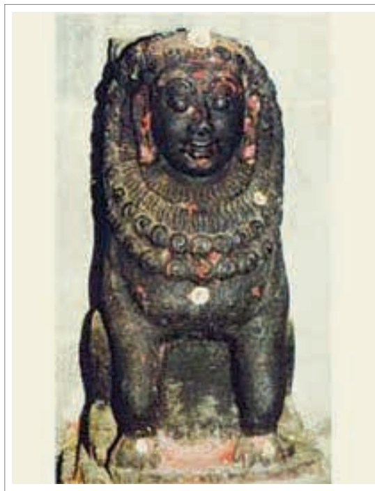
تصویر ۹: نقش برجسته اسفنگس هندی (مرد)، معبد