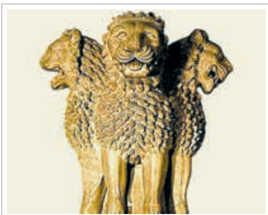
تصویر ۶: سر ستون سرنات، عهد آشوکا، ۲۵۰ ق م