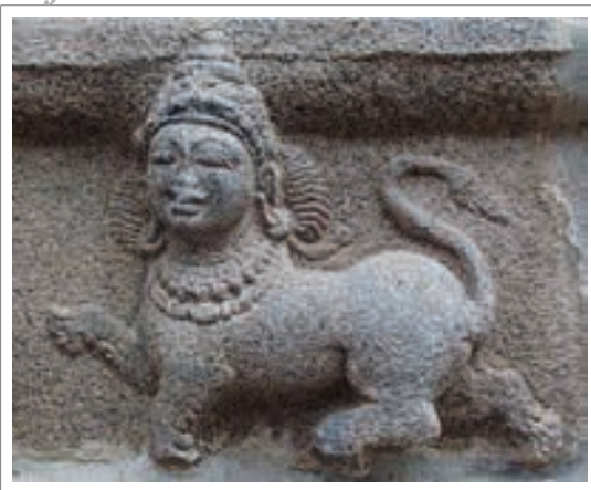
تصویر ۱۰: نقش برجسته اسفنگس هندی (زن)، معبد پرومال، ناتاراجا، چیدامبارام، هند تریپوانا، هند شیر در اساطیر و هنر ایران و هند