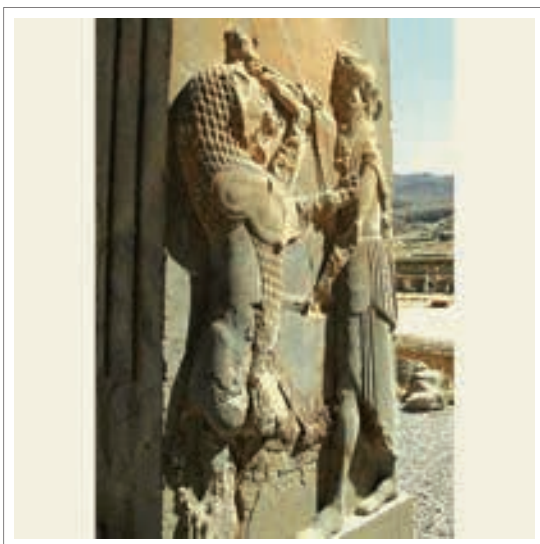
تصویر ۱: نقش برجسته نبرد شاه با شیر، تخت جمشید، دوره هخامنشی

در آیین مهرپرستی ایران، مقام ۳ چهارم میترا، منصب شیر می‌باشد به همین دلیل در پرده های نقاشی و سنگ برجسته های ایران، نقش شیر فراوان است. (آموزگار-تفضلی، ۱۳۸۱، ۱۳۵)