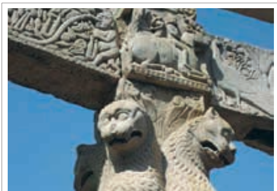
تصویر ۷: دروازه استوپای سانچی، قرن سوم ق م، موزه باستان شناسی سرنات، هند. معبدی در هامپی، هند.