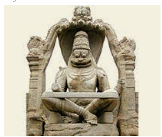
تصویر ۴: مجسمه سنگی ناراسیمها (انسان شیر)، معبدی