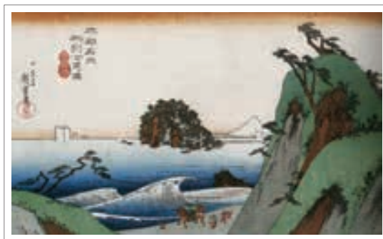
تصویر ۲: هیروشیگه (ح. ۱۸۳۲)، موج عظیم بر ساحل. (Forrer, p. 55)

برخلاف رویکرد غربی، منظره به امر بی‌جان و طبیعت مرده (nature morte) بدل نشده است. بلکه منظره به جای ترسیم یک امر ثابت و ساکن، به پویایی و گذران زندگی توجه می‌کند. در تصویر ۲ شاهد چنین رویکردی به طبیعت هستیم. با اینکه یکی از مؤلفه‌های این تصویر موج سهمگین دریاست اما هنرمند عمداً زاویه دید را به گونه‌ای انتخاب کرده است که از این واقعه دور باشد و علاوه بر این فضای پس‌زمینه را نیز در کنار آن ترسیم کند. بنابراین هنرمند علاوه بر بازنمایی موج، درصدد نشان دادن آرامش کلی موجود در فضاست و تأکید اصلی‌اش بر این آرامش است. این تصویر نشان می‌دهد که آرامش موجود در طبیعت در دل تغییرات و دگرگونی‌ها حاصل می‌شود. در تصویر ۳ کوه فوجی از پس امواج بازنمایی می‌شود. در این تصویر استواری و آرامش فوجی در تقابل با امواج دریاست. نقاش با این تقابل درصدد بیان تقابل میان نیروهای طبیعت و پیدایی آرامش از آنهاست.