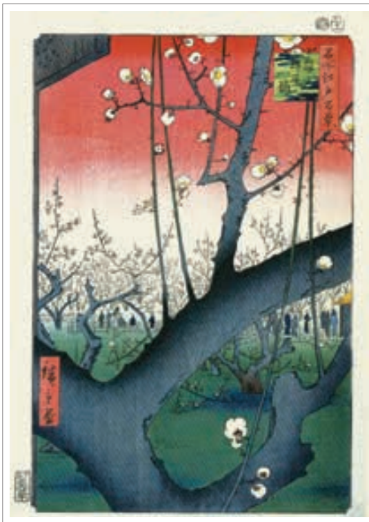
تصویر ۷: هیروشیگه (ح. ۱۸۵۶-۸). باغ آلو در کامی‌دو. (Forrer, p.93)