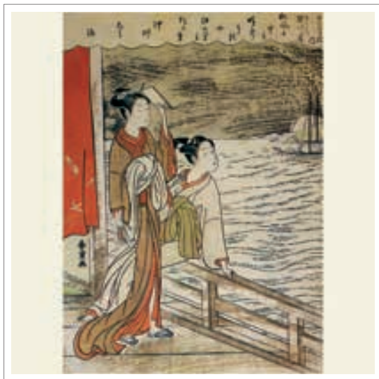
تصویر ۱: سوزوکی هاروشیکه. (۱۷۷۱). برف، ماه و گل‌ها؛ ماه برفراز شینگاوا. (Becker, p. 66)

البته باید توجه داشت که در اوکی‌یو-ئه با اینکه به نور و گذشت زمان توجه چندانی صورت نمی‌گیرد اما گذران زندگی همواره موضوع اصلی باسمه‌هاست. بازنمایی این گذران زندگی از طریق فضا سازی و منظره‌پردازی موجود در آن‌ها صورت می‌پذیرد. یکی از شگردهای این فضا سازی، اشاره به اموری است که در فضایی مبهم قرار دارند (Becker, 24). این فضای ابهام‌آلود علاوه بر اینکه به حضور مؤلفه‌ها اشاره دارد، بر غیاب آنها نیز تأکید دارد. این موقعیت دوگانه میان حضور و غیاب نوعی تلقی دگرگونی و گذران را در مخاطب ایجاد می‌کند. در این آثار، فضایی که آشکار است به سبب مه صبحگاهی دگرگون می‌شود و دیگر نمی‌توان شفافیت و وضوح آن را همان‌گونه دید که پیشتر دیده شده است. همچنین در این باسمه‌ها مؤلفه‌های غایب همان اندازه شایان توجه است که مؤلفه‌های حاضر در تصویر. در این مورد حالات فیگورها بر امر غایب دلالت می‌کنند و از این لحاظ نمی‌توان به حالات مختلف فیگورها کم توجه بود. به عنوان نمونه تصویر ۱ به افسانه‌ای اشاره دارد که می‌توان شمایل بودا را در بیست و ششمین روز از هفتمین ماه سال در ماه رویت نمود. در این تصویر بی‌آنکه ترسیم ماه اهمیت چندانی داشته باشد، حالات فیگورها و نحوه نگاه آنها به مؤلفه غایب از تصویر اشاره دارد. همین امر نشان‌گر دلالت امور ظاهر بر مؤلفه‌های غایب از تصویر است.