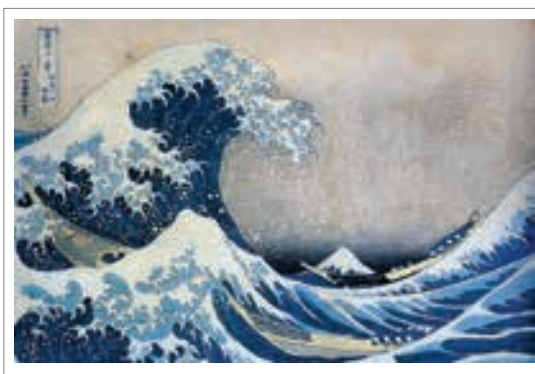
تصویر ۱۰: هوکوسای (ح. ۱۸۳۴-۱۸۲۱). از مجموعه سی‌وشش منظره از کوه فوجی.

تأکید هنرمندان اوکی‌یو-ئه بر واقعی بودن منظره به جای تقلیل آن به امر وانموده در رویکرد آنان به منظره‌پردازی حماسی نیز تأثیر گذاشته است. به‌طور کلی منظره‌پردازی حماسی بر امر والا (sublime) تأکید دارد که توأمان هم عواطف و هم حس وحشت را برمی‌انگیزد. این رویکرد در هنر مغرب زمین همراه با طرح مفهوم امر والا در زیبایی‌شناسی عصر روشنگری توسط ادmond برک و ایمانوئل کانت شکل گرفت. به‌طوری که منظره در این رویکرد از چنان عظمت و شکوهی برخوردار است که هرچیزی را از دایره توجه مخاطب خارج می‌کند. هنرمند با بازنمایی امر والا در صدد است تا قدرت تاریکی، ابهام، فقدان، آشفتگی و عظمت را که از خاستگاه‌های امر والا هستند، در معرض دید مخاطب قرار دهد. بنابراین امر والا بیان ترس و حیرت در کنار یکدیگر است که به تعبیر کانت به لذتی سلبی بدل می‌شود. ۳ چنین شیوه‌ای را نمی‌توان در باسمه‌های ژاپنی به منظره یافت. چرا که منظره‌پردازی ژاپنی به جای آنکه بر جنبه‌های رازآلود و بی‌ثبات طبیعت تأکید داشته باشد، بر مؤلفه‌هایی از ثبات و آشکارگی طبیعت توجه دارد. به عنوان نمونه در تصویر ۱۰، هوکوسای در یکی از سی و شش روایت خود از کوه فوجی، فرود امواج سهمگین دریا بر قایق‌ها را بازنمایی می‌کند اما غایت تصویر نشان‌دادن استواری کوه