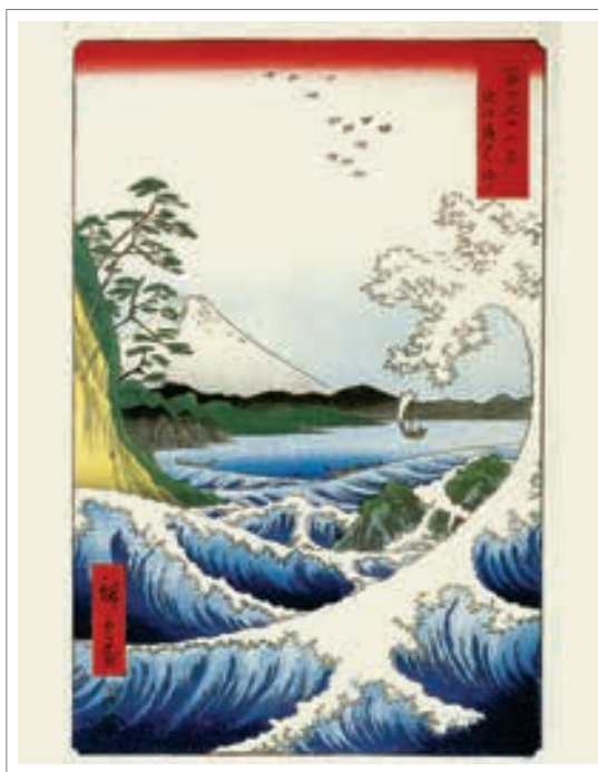
تصویر ۳: هیروشیگه (۱۸۵۸)، رویت فوجی از جانب دریای ناآرام. (Forrer, p. 78)