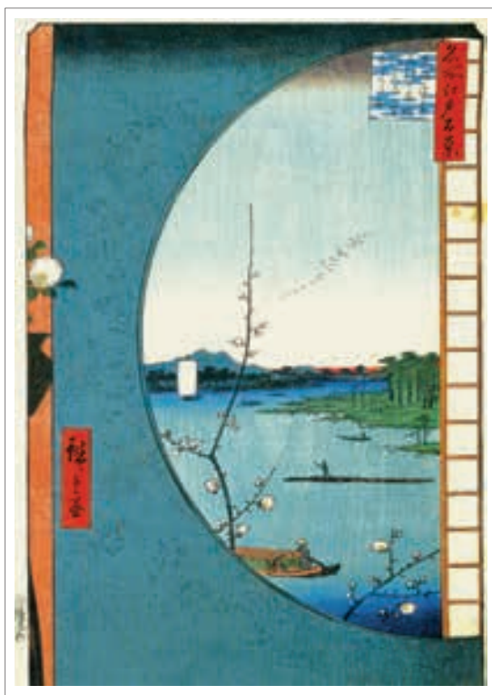
تصویر ۸: هیروشیگه (ح. ۱۸۵۶-۸). نگریستن از پنجره مدور. (Forrer, 102)

یکی از ویژگی‌های لازم منظره‌پردازی را قرارگرفتن در چارچوب مشخصی می‌دانند، بطوری که بر این مسأله اذعان دارند که «تصاویر در قاب پنجره از حالت طبیعت بکر خارج شده و به صورت منظره در می‌آیند» (Harris, 175) یا منظره‌پردازی را برداشتی از طبیعت یا تملک آن دانسته‌اند به نحوی که با خلق اثر هنری بتوان گفت که کدام طبیعت و کدام بازنمود طبیعت است (اندروز، ۱۳۸۸، ۲۶۵).