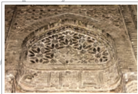
تصویر ۵: تزئینات قسمت جنوب غربی

در قسمت جنوب شرقی یکی از طاق‌نماها نقوش تفکیک شده برجسته دارد و قسمت دیگری که روی ضلع جنوبی منطبق است دارای نقوش ستاره مانند برجسته منظم و نامنظم می‌باشد که به تناوب تکرار شده است. در بخش بالاتر اشکال هندسی لوزی ماندی طراحی شده که به گونه عمود روی هم نصب شده‌اند و تداعی کننده بافت یا شبکه حصیری می‌باشند.