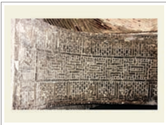
تصویر ۳: کتیبه خط کوفی آجری

در بخش ورودی شرقی تزئینات زیبای آجری بر پایه ستاره شش وجهی (شمسه شش و پیلی) می‌باشد که دارای جلوه‌های پویا و چرخشی است که بر اثر تکرار و پیوند ستاره‌ها در یکدیگر، بافت شکل هندسی زیبایی ایجاد کرده است. که با نمودی آستره هندسی و کاملاً تجسمی موجب شده که ماده ساختمانی به نظر نیاید و با واسطه آن سیر در عالم زیبایی ناب هندسه فراهم آید. این طرح بسیار متفاوت و تأمل برانگیز است و «هنرمند با کمترین امکانات مادی، خالص‌ترین اثر هنری فرازمان و فرامکان را بوجود آورده است». (همان، ۲۲۹)