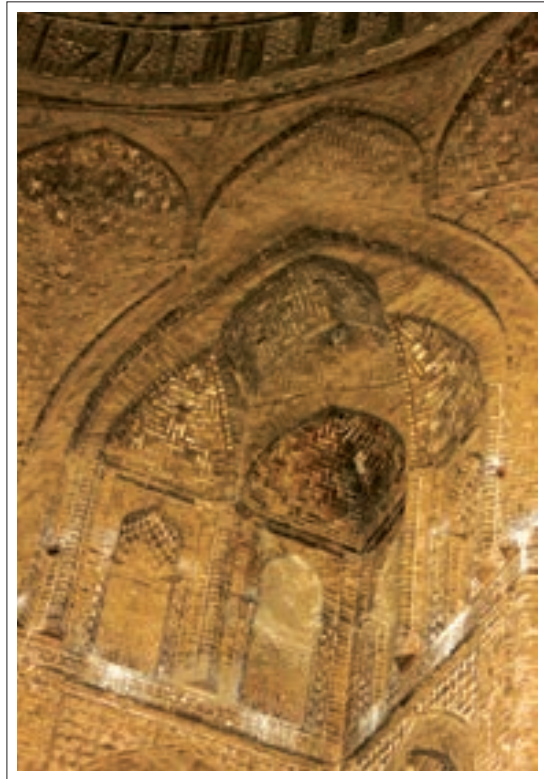
تصویر ۹: تزئینات پتکانه

دور تا دور ساقه گنبد کتیبه‌ای به خط کوفی ساده آجری برجسته می‌باشد که همچون کمربندی امتداد یافته است. متن کتیبه با بسم الله الرحمن الرحیم شروع می‌شود و با آیه ۵۴ سوره اعراف و نام بانی ساختمان، ابوالغنائم مرزبان ابن خسرو فیروز شیرازی (ملقب به تاج‌الملک) ادامه می‌یابد و در پایان سال ۴۸۱ هجری را نشان می‌دهد. (منرفر، ۱۳۵۰، ۷۷) متن به شرح زیر است: «بسم الله الرحمن الرحیم ان ربکم الله الذی خلق السموات و الارض فی سته ایام ثم استوی ... امر ببناء هذه القبة ابوالغنائم المرزبان بن خسرو فیروزختم الله بالخیر فی شهر سنه احدی و ثمانین و اربع مائه.» در بالا و پایین این کتیبه دونوارکه دارای تزئینات آجری می‌باشند قرار گرفته است. در زیر این کتیبه در ۳۲ پشت بغل موجود است که در هر یک از آنها دو کلمه به خط کوفی ساده با آجر به صورت برجسته اسامی و القاب خداوند نوشته شده است. (همان ۷۸، ۷۹) که به شرح زیر می‌باشد: