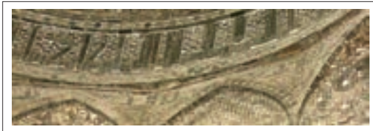
تصویر ۱۰: کتیبه ساقه گنبد و اسما الهی

تکرار اسما مقدس الهی و آیات قرآن بر تقدس این مکان می‌افزاید و بیش از هرچیز آنرا به مکانی روحانی و معنوی تبدیل می‌کند و مکانی را خلق می‌کند که سرتاسر معناسست و تاکید بیشتری بر این عبادتگاه می‌کند.