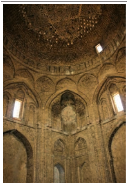
تصویر ۱: فضای گنبدخانه شمالی

قسمت مربع پایین بنا دارای دوازده طاق نما می‌باشد که پنج تای آنها باز و نقش ورودی بنا را ایفا می‌کنند و به جنوب و شرق راه دارند. هر یک از این طاق نماها را دو ستون مدور کوچک در دو طرف احاطه کرده است که از لحاظ چینش آجرها زیبا می‌باشد. این ستونها از آجرهای کوچک برجسته پوشیده شده که لابلای آنها قطعه های گچبری شده با نقش ضربدرکار شده است. در قسمت بالای شش طاق نما کشیده، کتیبه به خط کوفی ساده آجری برجسته اجرا گردیده، که بعد از جمله بسم الله الرحمن الرحيم ، آیه ۷۸ و ۷۹ سوره اسری به ترتیب از ضلع جنوب غربی نوشته شده است. (هنرفر، ۱۳۵۰، ۷۸) وجود آیات قرآنی در اینجا باعث