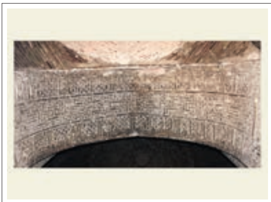
تصویر ۲: کتیبه هلال ورودی گنبدخانه

در قسمت ورودی اصلی به این بنا و در ضلع جنوبی گنبد خانه، در قسمت حاشیه هلال، خط کوفی ساده آجری به صورت برجسته دور تا دور هلال را پوشانده و در وسط آن فرم‌های هندسی آجری همراه با بندکشی‌های بسیار جذاب اجرا گردیده است. متن از سمت غرب و پایین قوس شروع می‌شود و شامل آیات ۲۶ و ۲۷ سوره آل عمران می‌باشد. (هنرفر، ۱۳۵۰، ۷۸) این کتیبه بسیار دقیق و با مهارت خاصی اجرا شده و تمام قوس را پوشانده است. «خواندن متن که از آیات قرآن می‌باشد بیننده را کمک می‌کند تا بیشتر در فضای معنوی مسجد قرار گیرد». (حلیمی، ۱۳۹۰، ۲۲۴)