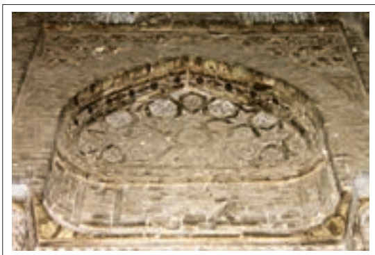
تصویر ۷: تزئینات قسمت شمال شرقی

در قسمت شمال شرقی و بالای کتیبه با نقوش هندسی بزرگ تزئین شده که چند ضلعی‌ها درشت‌تر و تفکیک شدت‌تر می‌باشند و نقوش ظریف گچی را احاطه کرده‌اند. در بالای این قسمت نقوش سه پر برجسته دیده می‌شود که بین آنها با نقوش گچی آرایش یافته و به تناوب تکرار شده و فضا را پوشانده‌اند.