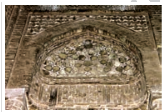
تصویر ۸: تزئینات قسمت جنوب شرقی

در قسمت شمال غربی و در بالای کتیبه تزئینات بسیار ظریف و ریز به شکل چند ضلعی‌های منظم و نامنظم اجرا شده است که از لحاظ ظرافت بسیار، شبیه نقوش خاتم‌کاری می‌باشد. در بخش بالاتر با ستاره‌های ۶ پر برجسته که در وسط آنها نیز نقوش ساده گچی طراحی شده، زینت یافته که مجدداً شاهد تکرار این ستاره‌ها می‌باشیم.