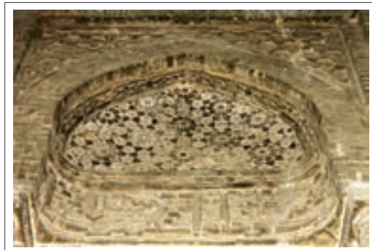
تصویر ۶: تزئینات قسمت شمال غربی

در قسمت هشت ضلعی بالا که هر ضلع دارای چند قسمت می‌باشد از تزئینات آجری و مهرهای گچی استفاده شده است. پتکانه‌ها دارای چهار طاق‌نما و مقرنسهای درشت می‌باشند که با چینش آجر به صورت عمود بر هم اجرا شده‌اند که علی‌رغم سادگی طرح بسیار جذاب و چشم‌نواز می‌باشند. در قسمت‌های وسط هم دارای سه طاق‌نما می‌باشد که ضلع میانی به عنوان نورگیر و تهویه هوا عمل می‌کند.