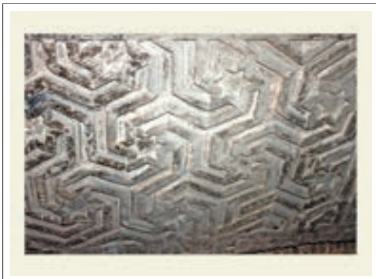
تصویر ۴: تزئینات ورودی شرقی برپایه ستاره شش وجهی

در بخش ورودی شرقی تزئینات زیبای آجری بر پایه ستاره شش وجهی (شمسه شش و پیلی) می‌باشد که دارای جلوه‌های پویا و چرخشی است که بر اثر تکرار و پیوند ستاره‌ها در یکدیگر، بافت شکل هندسی زیبایی ایجاد کرده است. که با نمودی آستره هندسی و کاملاً تجسمی موجب شده که ماده ساختمانی به نظر نیاید و با واسطه آن سیر در عالم زیبایی ناب هندسه فراهم آید. این طرح بسیار متفاوت و تأمل برانگیز است و «هنرمند با کمترین امکانات مادی، خالص‌ترین اثر هنری فرازمان و فرامکان را بوجود آورده است». (همان، ۲۲۹)