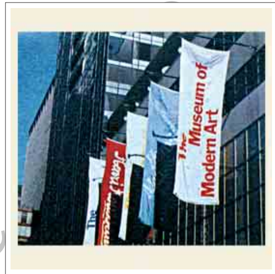
تصویر ۴: پرچم تبلیغاتی موزه هنری

نمایشگاه‌های بین‌المللی، مراکز تجاری و سایر مکان‌هایی که جهت برطرف کردن نیازهای روزانه مردم ایجاد می‌شوند از استفاده‌کنندگان دائمی و همیشگی پرچم‌های تبلیغاتی بوده‌اند. مراکز تفریحی نیز از مکان‌های مهمی به شمار می‌روند که از اینگونه پرچم‌ها استفاده زیادی به عمل می‌آورند. پارک‌هایی نظیر دیزنی‌لند (Disney Land) در فلوریدا از پرچم‌ها برای افزودن رنگ و هیجان به محیط استفاده می‌کنند و علاوه بر آن وظیفه تأکید بر موضوع پارک و هدفی که پارک بر آن اساس برپا شده را نیز برعهده دارند. پرچم‌هایی که دارای اشکال موج و عناصری با رنگ‌های آبی سرد و آرام می‌باشند، تأکید شده است. (تصاویر ۴ و ۵)