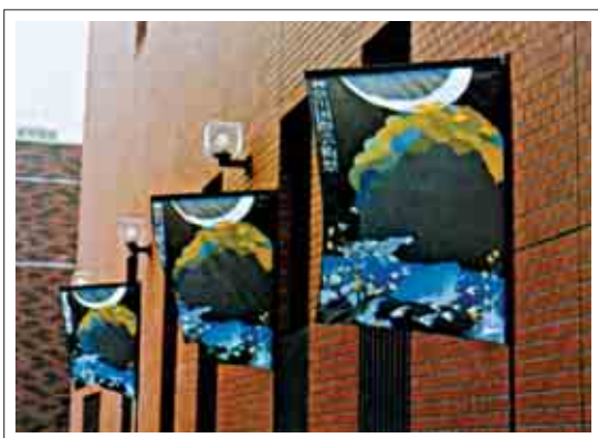
تصویر ۳: پرچم تبلیغاتی موزه‌ها

موزه‌ها و گالری‌ها نیز دارای پرچم‌هایی هستند که در عین حال که خود یک اثر هنری زیبا و خوش ساخت به شمار می‌روند، مردم را از نمایشگاه آثار هنری که برپا شده است آگاه می‌سازند. البته باید خاطر نشان کرد که تأثیر شگفت‌انگیز این پرچم‌ها تا حد زیادی بستگی به انطباق زمانی با رویداد هنری آنها دارد، به این معنی که پرچم‌ها هنگامی زیبایی و تأثیرشان آشکار می‌شود که همزمان با برگزاری مراسم موزه یا گالری به اهتزاز درآیند و بعد از به پایان رسیدن این زمان تا حد زیادی از کاربرد آنها به عنوان رسانه‌ای جهت آگاه کردن مخاطبین کاسته می‌شود اما همچنان ماهیت آنها به صورت اثری هنری و جذاب باقی می‌ماند. بنابراین طراح در طراحی اینگونه پرچم‌ها نکاتی را باید مد نظر داشته باشد که شاید در پرچم یک کارخانه سازنده اتومبیل اهمیت چندانی نداشته و نکات دیگری لحاظ شوند.