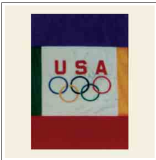
تصویر ۱۰: پرچم مسابقات ورزشی المپیک

به چشم می‌خورد. بخش دیگری از این پرچم‌ها در سردر مغازه‌ها، فروشگاه‌ها، رستوران‌ها و فضاهای داخلی آنها استفاده می‌شود که در این صورت نیز هم جنبه اطلاع رسانی و هم تبلیغاتی دارند زیرا هم وسیله‌ای جهت معرفی و آگاه کردن مردم از نام یا نوع فعالیت آن فروشگاه یا رستوران می‌باشد و هم تبلیغ کالاهای آن مکان یا غذای آن رستوران را برعهده دارند. علاوه بر آن با رنگ‌های شاد و درخشانی که در طراحی آنها به کار می‌رود به خیابانها و فضاهای داخلی فروشگاه‌ها و رستوران زیبایی خاصی می‌بخشد و مردم را به وجد می‌آورد که در این صورت نقش تزئیناتی نیز ایفا می‌کنند. (تصاویر ۸ و ۹)