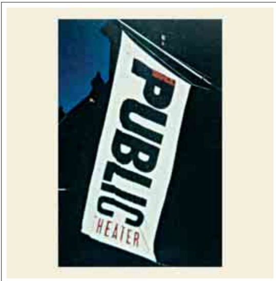
تصویر ۱۸: پرچم تبلیغاتی فروشگاه