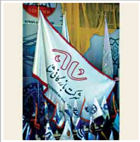
تصویر ۱۷: پرچم تجاری شرکت