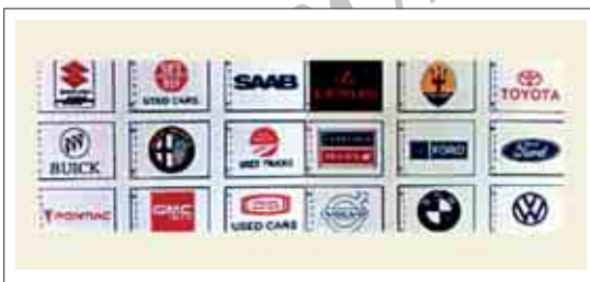
تصویر ۷: پرچم‌های تبلیغاتی کارخانجات سازنده اتومبیل

اینگونه کارخانجات جهت جذب عموم مردم و استفاده آنها از اتومبیل، تبلیغات روزافزون و گسترده‌ای را در این زمینه آغاز کردند. در این گروه از پرچم‌ها، معرفی، شناسایی کارخانه و تبلیغ محصولات آن و ماندگار شدن آن در ذهن مخاطب و در بعضی موارد اطلاع‌رسانی، از جمله اهدافی است که طراح در پی آن بوده است، این ویژگی در سایر پرچم‌های این گروه نظیر پرچم بانک‌ها، فروشگاه‌ها و ... نیز