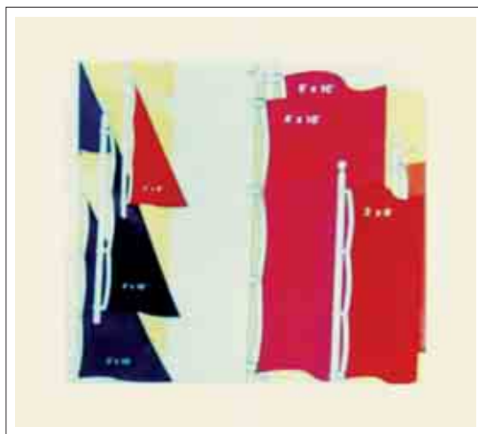
تصویر ۲۲: تصاویری از اشکال متفاوت کادر

در آنجا به اهتزاز در می‌آید و یافتن راه حل مناسب برای برقراری نوعی ترکیب سازگار میان این دو، به او در تبدیل محیطی کسالت آور و یکنواخت به فضایی جذاب و سرگرم کننده کمک های شایانی می‌کند. (تصاویر ۲۲ و ۲۳)