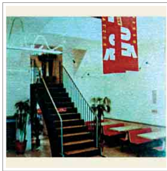
تصویر ۹: پرچم تبلیغاتی در فضای داخلی رستوران