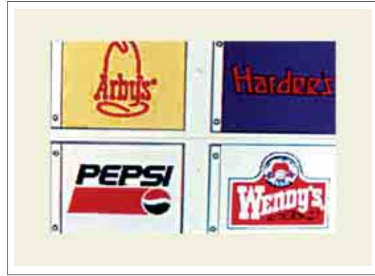
تصویر ۲۱-رنگ، عنصر اصلی به کار رفته در این پرچم هاست.

همانطور که گفته شد عنصر کادر در صورت داشتن ارتباط منطقی با پیام خود، به عنوان عاملی در انتقال آن نقش مهمی دارد. دقت در انتخاب شکل کادر و ابعاد آن توسط طراح و همینطور بررسی و تحلیل فضایی که پرچم