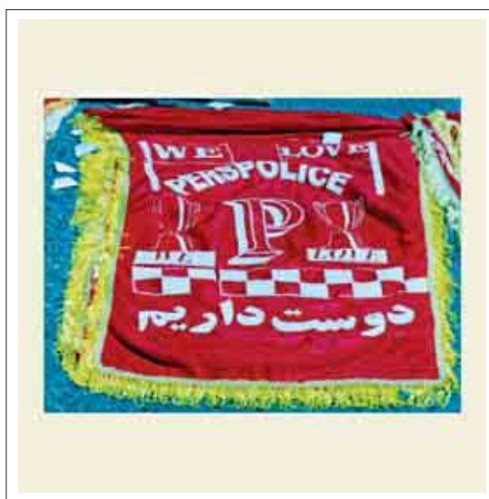
تصویر ۱: پرچم تبلیغاتی ورزشی

بعضی از مراکز خرید، تفرج‌گاه‌هایی در فضای باز دارند که دارای مکان‌هایی جهت نصب پرچم‌ها می‌باشند و به این ترتیب برای ایجاد محیطی الوان، پویا و پرتحرک، بخش‌هایی از پیش تعبیه شده است. هدف دیگر طراحان این پرچم‌ها که همان مطلع کردن عموم مردم از رویدادهای تجاری و دعوت آنها به شرکت در این مراسم می‌باشد نیز به این ترتیب برآورده می‌شود. (prejza, 1994, 11) (تصاویر ۳ و ۲)