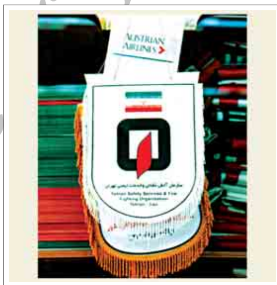
تصویر ۲۳: نمونه ای از پرچم روییزی با کادری مشخص