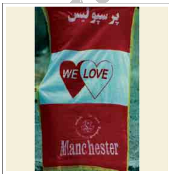
تصویر ۱۱: پرچم تبلیغاتی تیم فوتبال