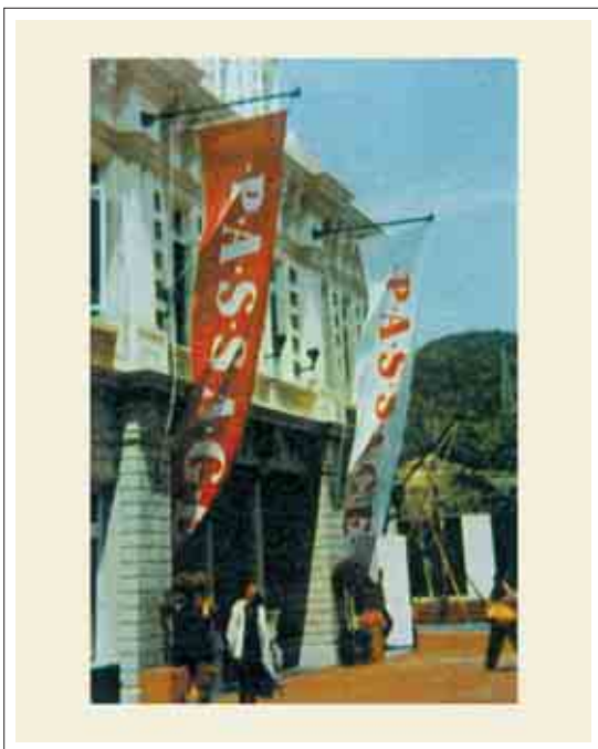
تصویر ۲: پرچم تبلیغاتی مراکز دولتی