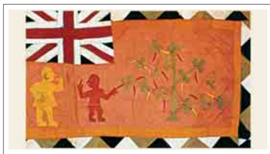
تصویر ۱۹: پرچم فرهنگی مربوط به قبیله ای آفریقایی به نام Asafo

در گونه های از پرچم های تبلیغاتی نظیر پرچم های تجاری که برای شرکت ها، کارخانجات و مراکز تولیدی طراحی می شوند، تصویر مشخص و از پیش تعیین شده آن مؤسسه که همان نشانه آن می باشند وجود دارد و در مراحل بعد سایر تصاویر و عناصر بصری باید در ارتباط و در جهت تأکید به اهمیت این نشانه و ارزش دادن به آن عمل کنند و عناصر تصویری یا نوشتاری دیگر باید در راستای عملکرد اهداف آن شرکت باشند. ویژگی مهم و اساسی دیگر این تصاویر، واضح بودن آنهاست بدین معنا که از فواصل دور که همان ارتفاع پرچم می باشد، قابل شناسایی و درک باشند و گنگ و نامفهوم به نظر نرسند و به همین دلیل است که عموماً از تصویرسازی های واقع گرا و دارای جزئیات بسیار در طراحی اینگونه پرچم ها کمتر استفاده می شود. مگر در مواردی خاص نظیر پرچم های رومیزی. (تصاویر ۱۹ و ۲۰)