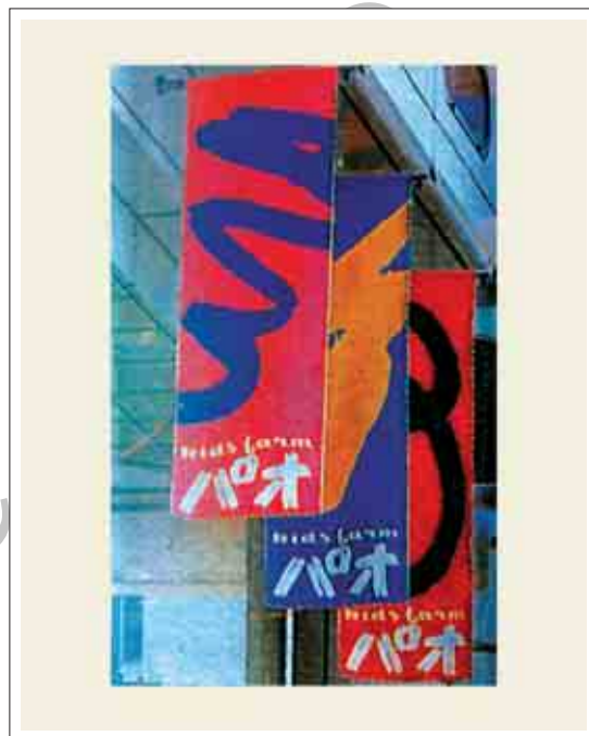
تصویر ۸: پرچم تبلیغاتی و تزئیناتی مراکز خرید