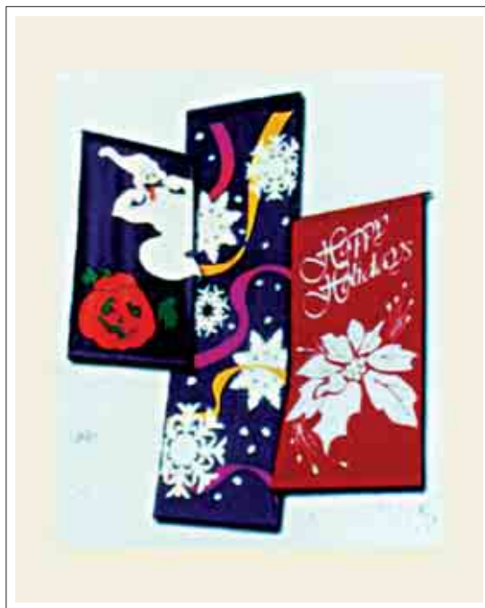
تصویر ۱۴: پرچم‌های تزئیناتی مخصوص ایام خاص در سال