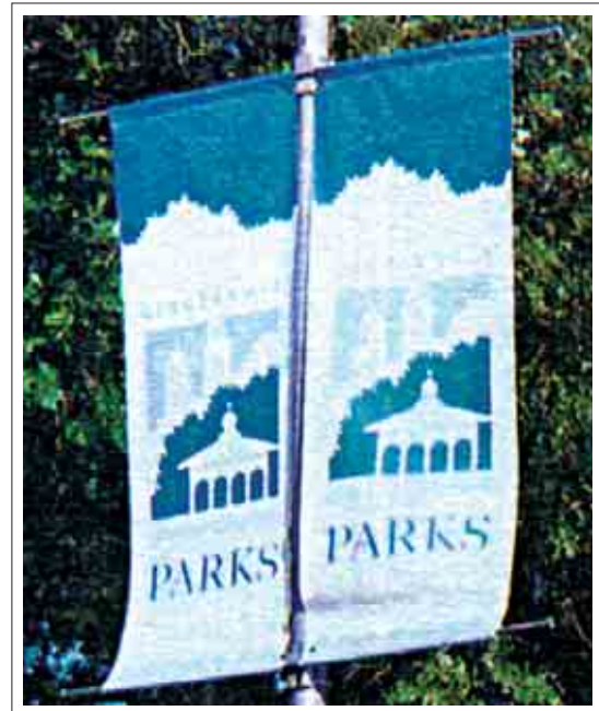
تصویر ۵: پرچم تزییناتی مراکز تفریحی