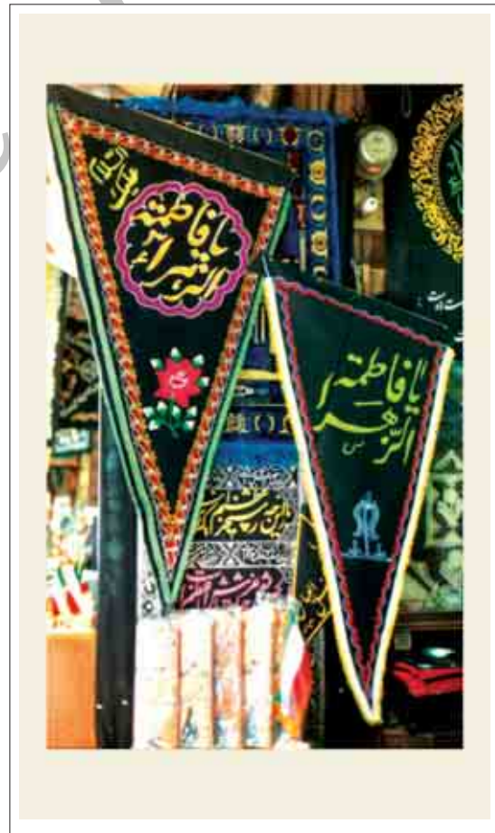
تصویر ۱۲: پرچم تبلیغاتی مذهبی

این پرچم‌ها مخصوص ایام تعطیلات، ایام خاص در سال، اعیاد و تغییر فصول سال طراحی و اجرا می‌شوند. اینگونه پرچم‌ها در بیشتر کشورها خصوصاً در ایام کریسمس و روزهایی که به مناسبت‌های خاص اختصاص دارند در درب ورودی منازل، فروشگاه‌ها، مدارس و مکان‌هایی از این نوع به اهتزاز درمی‌آیند. حتی در این کشورها و در این ایام مردم این پرچم‌ها را به عنوان یادگاری به همدیگر هدیه می‌دهند. هدف اساسی آنها علاوه بر گرامیداشت این اعیاد و ایام، تبلیغ و معرفی رویدادهایی است که در این روزها اتفاق افتاده، مضاف بر اینکه تزئین و ایجاد محیطی جذاب و شاد از دیگر وظایف آنها می‌باشد. (Ifnocfr, 1990, 82) (تصویر ۱۴)