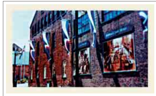
تصویر ۱۵: پرچم تبلیغاتی در فضای خارجی موزه

- فاصله میان حروف، کلمات و خطوط رعایت شوند. - جنس مواد به کار رفته در آنها باید بادوام و دارای استقامت زیاد در شرایط مختلف جوی باشد. (prejza, 1994, 241) علاوه بر کاربردهای عملی پرچم‌ها، مهمترین وظیفه‌ای که هر پرچم دارا می‌باشد توانایی به اجرا درآوردن یک پروژه خیالی و فضایی تخیلی و جذاب در یک مکان است که این مورد به همراه سایر عناصر گرافیک محیطی نقش تأکیدی خواهد داشت. رنگ‌های متنوع و اشکال خیالی، محیطی سرگرم کننده و شادی آور را برای بازدیدکنندگان از مکانی فراهم می‌کند. یک سیستم جامع کاربردی، جذاب، شاخص و قابل اجرا نه تنها تماشاگران را تحت تأثیر قرار می‌دهد بلکه موجب احساس راحتی و آسایش در آنها می‌گردد و آن محیط را به فضایی دوست داشتنی و دیدنی مبدل می‌سازد. (تصاویر ۱۵ و ۱۶)