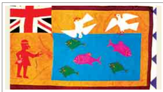
تصویر ۲۰: پرچم فرهنگی مربوط به قبیله ای آفریقایی به نام Asafo