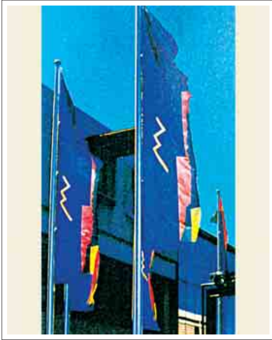
تصویر ۱۶: پرچم تبلیغاتی در نمایشگاه تجاری