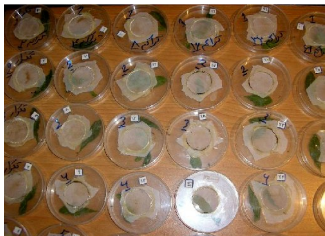
شکل ۱: ظروف استفاده شده در آزمایش واکنش تابعی