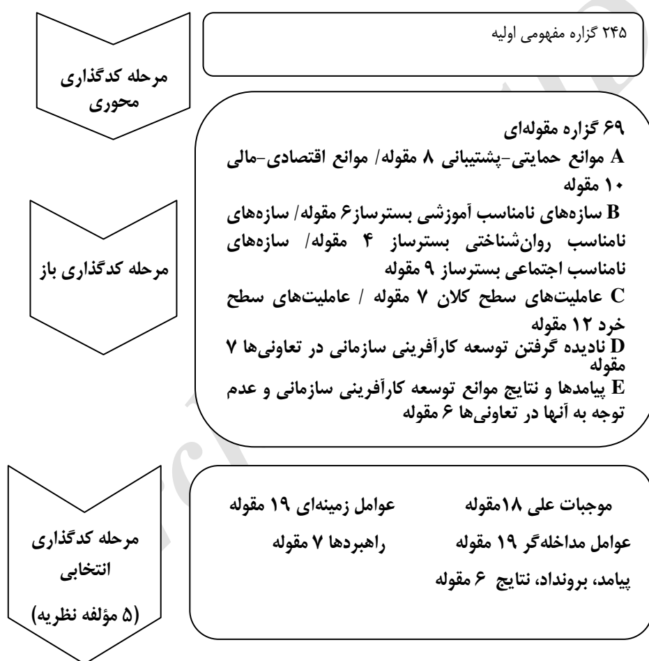
شکل ۱. جریان تقلیل داده‌ها در سه مرحله کدگذاری

دسته عنوان مناسب داده می‌شود و سپس از دل آنها مفاهیم ۱ و مقولات ۲ استخراج و از این رهگذر خوشه‌های مفهومی تشکیل می‌گردد که هر یک به مقولاتی تعلق دارند و سرانجام از ارتباط این مقولات است که شالوده‌ای سامان می‌یابد و مدل مورد نظر برای توضیح یک پدیده خلق می‌شود (رستمی و همکاران، ۱۳۹۳). به طور کلی، روند تحلیل در قالب شکل ۱ نشان داده شده است.