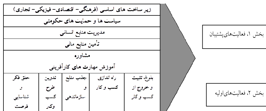
شکل ۱. مدل زنجیره ارزش کارآفرینی (احمد امینی و همکاران، ۱۳۸۹)

از آنجاکه زنجیره ارزش برای بنگاه‌های مختلف متفاوت است (غفاری داراب و همکاران، ۱۳۹۳)، لذا مجموعه حوزه‌های کاری تشکیل‌دهنده زنجیره ارزش در بنگاه‌های مختلف تأثیرات متفاوتی بر ارزش و توان رقابتی و اجرایی ایجادشده به جا می‌گذارند. بر همین اساس، پژوهش حاضر به ارزیابی و آسیب‌شناسی ابعاد زنجیره ارزش در تعاونی‌های روستایی، به عنوان عمده کسب‌وکارهای روستایی، پرداخت.