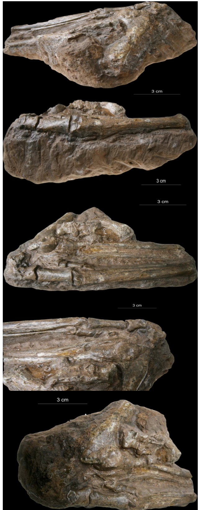
تصویر ۲- مقیاس ۳ سانتی متر. نمونه‌ی اکتشاف شده شامل یک قطعه بلوک با چندین استخوان قلم دست و بند انگشتان هیپاریون می‌باشد استخوان مورد نظر همان انگشت III بوده که نسبت به سایر انگشتان بزرگ‌تر باقی مانده است. در استخوان بند انگشت (Digites)، زوائد باقی مانده است.

اجداد اسب‌های هیپاریون، اولین بار در آمریکای شمالی ظاهر شده، سپس هم‌زمان با پایین آمدن سطح آب دریاها، از تنگه‌ی برینگ گذشته و وارد دنیای قدیم شدند و تا پایان پلیوسن باقی ماندند. اسب‌های هیپاریون، از نقاط مختلفی چون سیوالیک (Siwalik) در هند و پاکستان، سیناپ (Sinap) در ترکیه، هوواناگ (Howenegg) و اپلیشم (Eppelsheim) در آلمان، والنز (Valens) در اسپانیا و در نقاط دیگری مانند شمال الجزایر و شرق کنیا، چین، روسیه و مغولستان گزارش شده است.