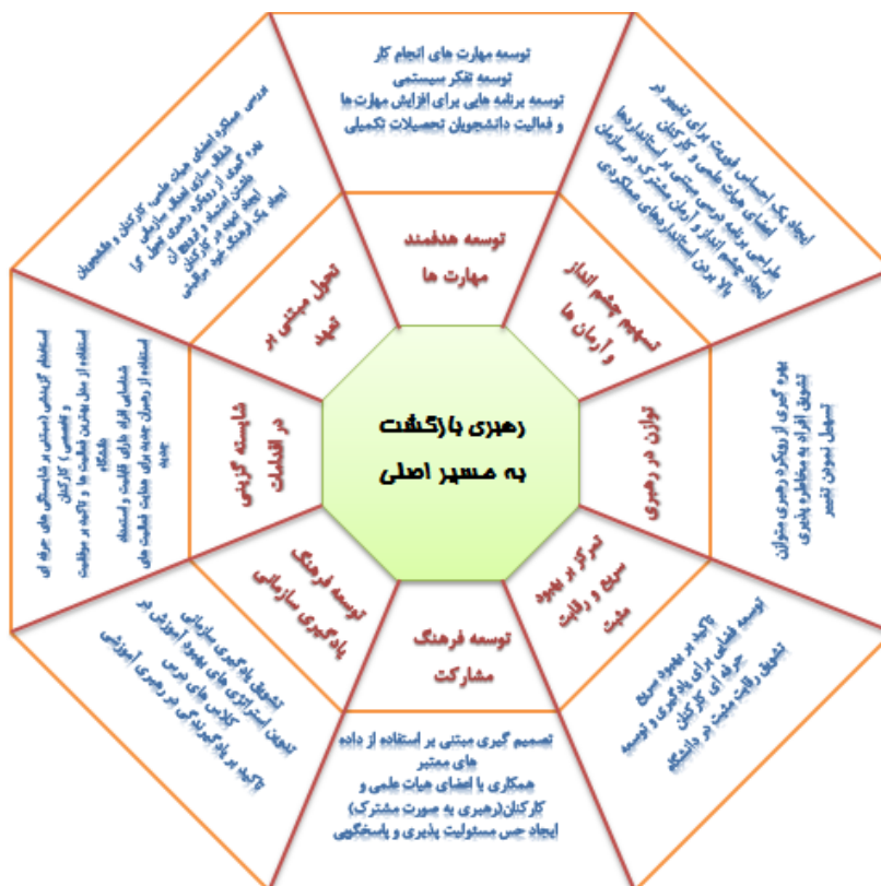
شکل ۲. مدل رهبری بازگشت به مسیر اصلی در نظام آموزش عالی ایران

هشت عاملی (فرآیند) با ۲۹ گویه (فعالیت) تأیید شد. عامل‌های حاصل بر اساس مبانی نظری نام‌گذاری شدند.