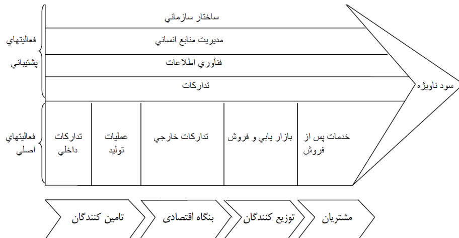
شکل ۱. زنجیره ارزش پورتر (پورتر، ۱۹۸۵)

فعالیت‌های اصلی، فعالیت‌هایی است که اصطلاحاً ارزش افزا نامیده می‌شود (شقایق و نقشینه، ۱۳۸۸، ص. ۵۳).