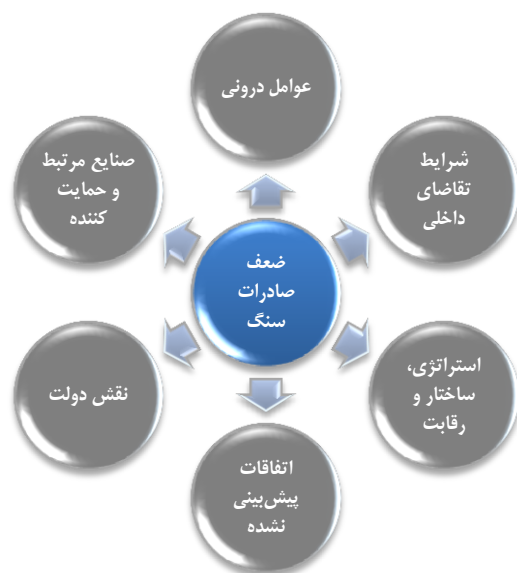
شکل ۴. مدل نظری تحقیق