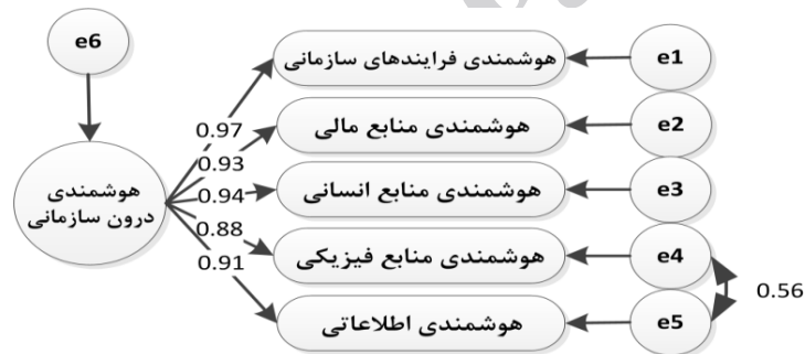
شکل ۳. مدل مفهومی اصلاح‌شده پژوهش به همراه ضرایب رگرسیونی

پس از بررسی روایی سازه، مدل اندازه‌گیری پژوهش با استفاده از شاخص‌های برازش مطلق، برازش تطبیقی و برازش مقتصد مورد آزمون قرار می‌گیرند تا میزان هم‌خوانی مدل مفهومی پژوهش با داده‌های تجربی مورد بررسی قرار گیرد. مقادیر مربوط به هر یک از این شاخص‌ها در جدول ۵ آمده است. در این جدول، برخی از شاخص‌های برازش مدل، وضعیت قابل قبولی را نشان نمی‌دهند و این به آن مفهوم است که مدل مفهومی پژوهش توسط داده‌های تجربی مورد حمایت قرار نمی‌گیرد و بایستی این مدل اصلاح شود. با ایجاد یک رابطه دوسویه میان e4 و e5 مدل مفهومی پژوهش بهبود می‌یابد (شکل ۳).