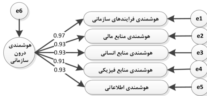
شکل ۲. ترسیم مدل مفهومی اولیه در نرم‌افزار Amos

استفاده کرد. این روش پژوهشگر را قادر می‌سازد تا مدل نظری مورد مطالعه را مفهوم‌سازی کند. به همین دلیل می‌توان مدل پژوهش را از نظر آماری و در یک تجزیه و تحلیل همزمان مورد آزمون قرارداد و مشخص نمود که آیا مدل پژوهش با داده‌های پژوهش سازگار است یا خیر [۱]. تصویر مدل مفهومی پژوهش در نرم‌افزار Amos به صورت شکل ۲ نشان داده شده است: