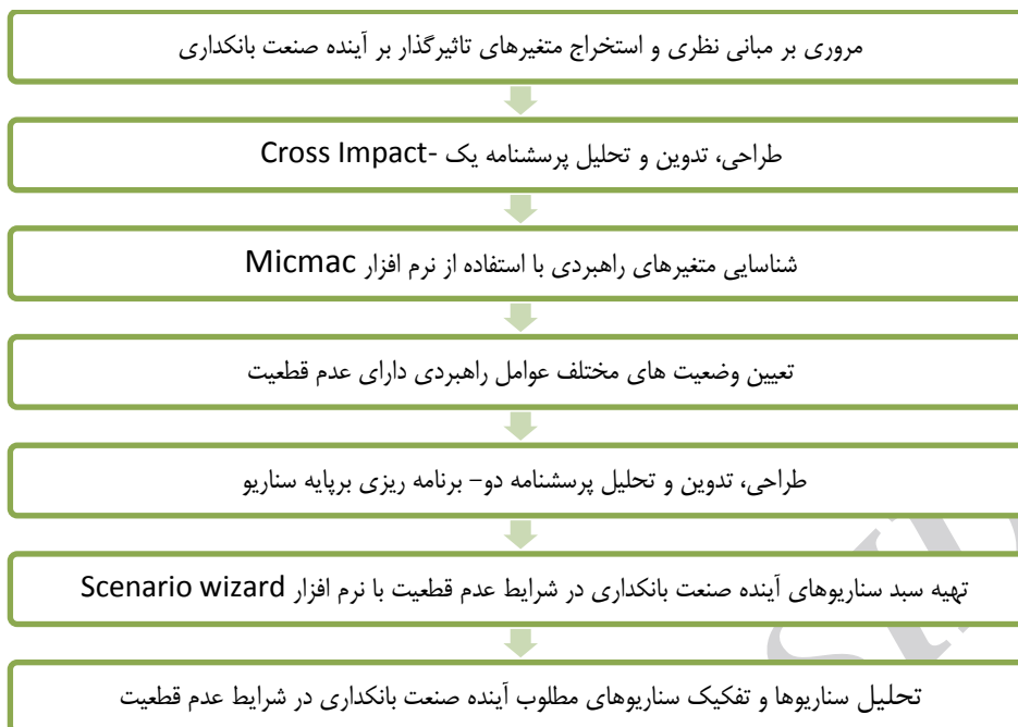
شکل ۲. فرآیند انجام پژوهش

جامعه و نمونه آماری پژوهش. جامعه آماری در این پژوهش شامل مجموعه‌ای از متخصصان و خبرگان صنعت بانکداری که از دیدی آینده‌پژوهانه و راهبردی برخوردار بودند که حجم آن در حدود ۳۰ نفر برآورد می‌شود. نمونه آماری متشکل از ۸ نفر از خبرگان حوزه یادشده است که براساس روش نمونه‌گیری از نوع «نمونه‌گیری قضاوتی و هدفمند» و در دسترس انتخاب شدند. با توجه به نوع جامعه آماری موردنظر و با توجه به نوع اطلاعات لازم برای انجام پژوهش، از نمونه‌گیری یادشده استفاده شده است. در جدول ۱، به ویژگی‌های جمعیت‌شناسی نمونه‌های پژوهش (توزیع جنسی و سنی میزان تحصیلات و شغل) پرداخته شد.