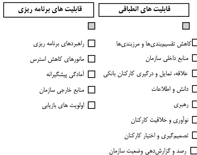
شکل ۱. شاخص‌های تاب‌آوری بانکی [۲]

الروب در سال ۲۰۱۵ در رساله دکتری خود، شاخص‌های تاب‌آوری بانکی را در دو گروه کلی قابلیت‌های انطباقی و برنامه‌ریزی دسته‌بندی کرده است [۲]. در شکل ۱، نمایی از مدل الروب ارائه شده است.