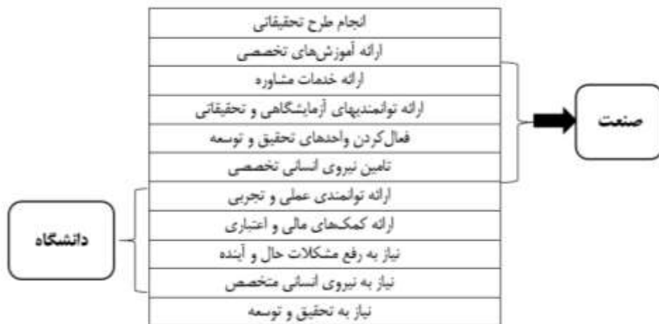
شکل ۱. ارتباط دانشگاه و صنعت [۱۳]

دلایل همکاری صنعت و دانشگاه: دلایل مختلفی برای همکاری صنعت با دانشگاه‌ها وجود دارد: اول، این امر از روند استخدام در شرکت پشتیبانی می‌کند. دوم، این یک شریک پایدار برای اقدامات پژوهشی ایجاد می‌کند. و سوم، این عامل یک منبع برای نوآوری است. دانشجویان و پژوهش‌گران درگیر در این همکاری به‌منزله کارمندان بالقوه دیده می‌شوند. از طریق همکاری پژوهشی، صنعت‌ها دسترسی به کارکنان ماهر خواهند داشت. دانشگاه‌ها دارای شبکه‌های بزرگ و جهانی هستند که دانش و شایستگی ایجاد می‌کنند و باعث ایجاد خلاقیت می‌شوند [۱۰]. منابع صنعت شرایط همکاری را برای نوآوری فراهم می‌آورند، هنگامی که صلاحیت و خلاقیت در محصولات و خدمات برای مشتریان قابل اجرا باشد. صنعت و نگاه‌ها در قالب پروژه‌های دانشجویی، دانشجویان پایان‌نامه کارشناسی ارشد، دکتری با دانشگاه‌ها همکاری می‌کند. سطوح مختلف مکانیسم‌های همکاری بین صنعت و دانشگاه‌ها را الفستر و همکاران مطابق نمودار [۱۰] توصیف کرده است.