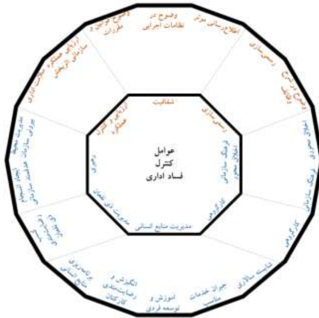
شکل ۳. تحلیل مضامین تبیین‌شده در الگوی پیشنهادی پژوهش

در مصادیق پژوهش جنبه ساختاری مانند رسمی‌سازی و شفافیت، مصادیقی دیده می‌شوند که جنبه انسانی دارند مانند مدیریت منابع انسانی و یا رهبری. این عوامل در تعامل با یکدیگر سازمان را برای کنترل فساد اداری تکمیل و رو به تعالی سوق می‌دهند. فرهنگ سازمانی کارکنان را تحت تأثیر قرار می‌دهد و از سویی کنش کارکنان در مواجهه با مسائل و فرآیندها است که فرهنگ را به وجود می‌آورد لذا تعامل دو سویه موجود است که سازمان را در قالب عوامل ساختاری و انسانی شکل می‌دهد. سازمانی که دارای فرهنگ فسادستیزی و فسادگریزی باشد، افرادی تمایل به کار در آن دارند که این خصیصه را دنبال می‌نمایند و کارکنانی را جذب می‌کند که در این راستا باشند و این چرخه باعث به وجود آمدن سازمانی عاری از فساد می‌گردد. اما اگر سازمانی در جامعه، شهره به فساد باشد، محملی خواهد بود برای جذب افراد سودجو و فاسد، به نحوی که در کنش متقابل بین ساختار فاسد و انسان فاسد، گسترش فساد بیشتری اتفاق خواهد افتاد. در چنین سازمان‌هایی فساد مفروض پنداشته می‌شود و در نتیجه با سهولت بیشتری رواج می‌یابد و در ساختارها و فرآیندهای سازمانی تعبیه می‌شود و رفتاری مجاز و مطلوب توسط اعضای سازمان درونی می‌گردد و حتی به نسل‌های بعدی کارکنان نیز اشاعه می‌یابد.