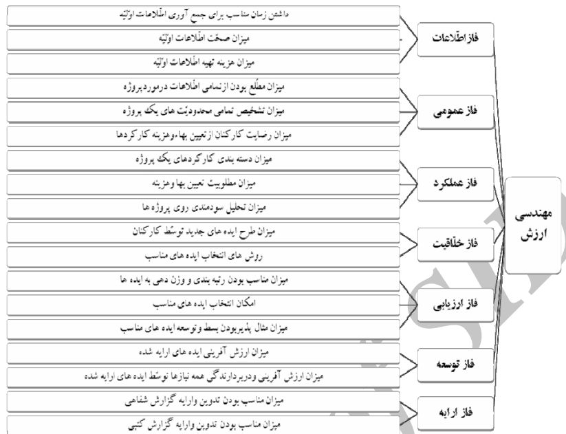
شکل ۱: مدل عملیاتی مهندسی ارزش

براساس چارچوب نظری تحقیق، مدل عملیاتی و فرایند شاخص سازی متغیرهای مستقل و وابسته تحقیق به صورت زیر ارایه می‌شود: