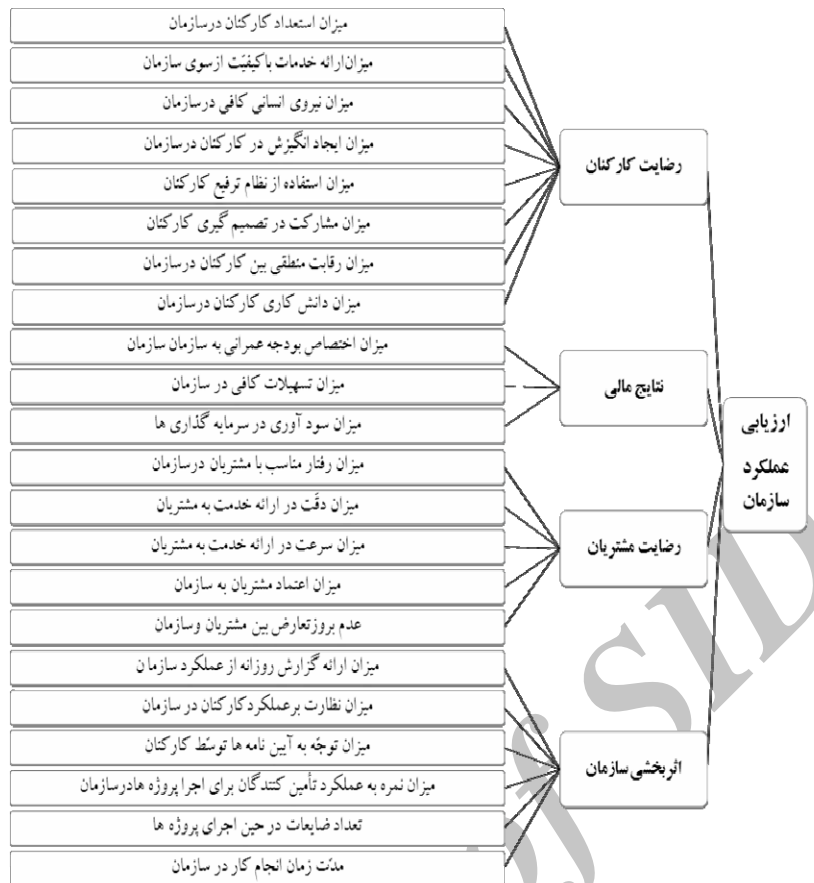
شکل ۲: مدل عملیاتی عملکرد سازمانی

هدف اصلی تحقیق حاضر بهبود عملکرد سازمانی اداره آب و فاضلاب استان آذربایجان غربی با تأکید بر مهندسی ارزش می‌باشد و در این راستا اهداف فرعی تأثیر متغیرهای رضایت کارکنان، رضایت مشتریان، اثربخشی سازمانی و نتایج مالی و بازار بر بهبود عملکرد سازمان دنبال می‌شود.