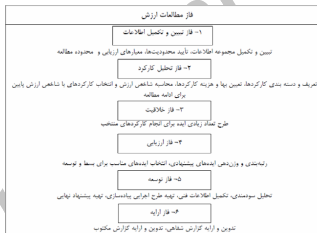
شکل شماره ۲-۲: برنامه کاری کارگاه مهندسی ارزش

بر اساس استاندارد وزارت دفاع و پ. ن. م. ج. ا. ا. برنامه کاری اجرای فاز مطالعات ارزش (ربانی و رضایی و حاجی، ۱۳۸۳، ۵۳) به صورت نشان داده شده در شکل ۲-۲ می باشد: