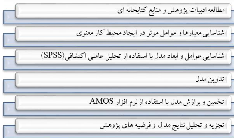
شکل شماره ۱- مراحل انجام پژوهش

و روایی پرسش نامه طراحی شده بر اساس آلفای کرونباخ و آزمون بارهای عاملی مورد ارزیابی قرار می‌گیرد. شکل شماره ۱ مراحل انجام پژوهش را نشان می‌دهد.