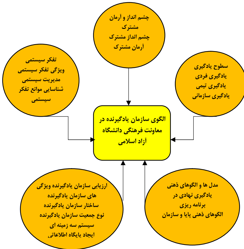
شکل شماره (2) - مدل حاصل از تحلیل محتوای کیفی

مدل نهایی تحقیق متغیر های مورد بررسی در این تحقیق عبارتند از: متغیر مستقل: سطوح یادگیری، تفکر سیستمی، چشم انداز و آرمان مشترک، مدل ها و الگوهای ذهنی و ارزیابی سازمان یادگیرنده متغیر وابسته: الگوی سازمان یادگیرنده در معاونت فرهنگی دانشگاه آزاد اسلامی