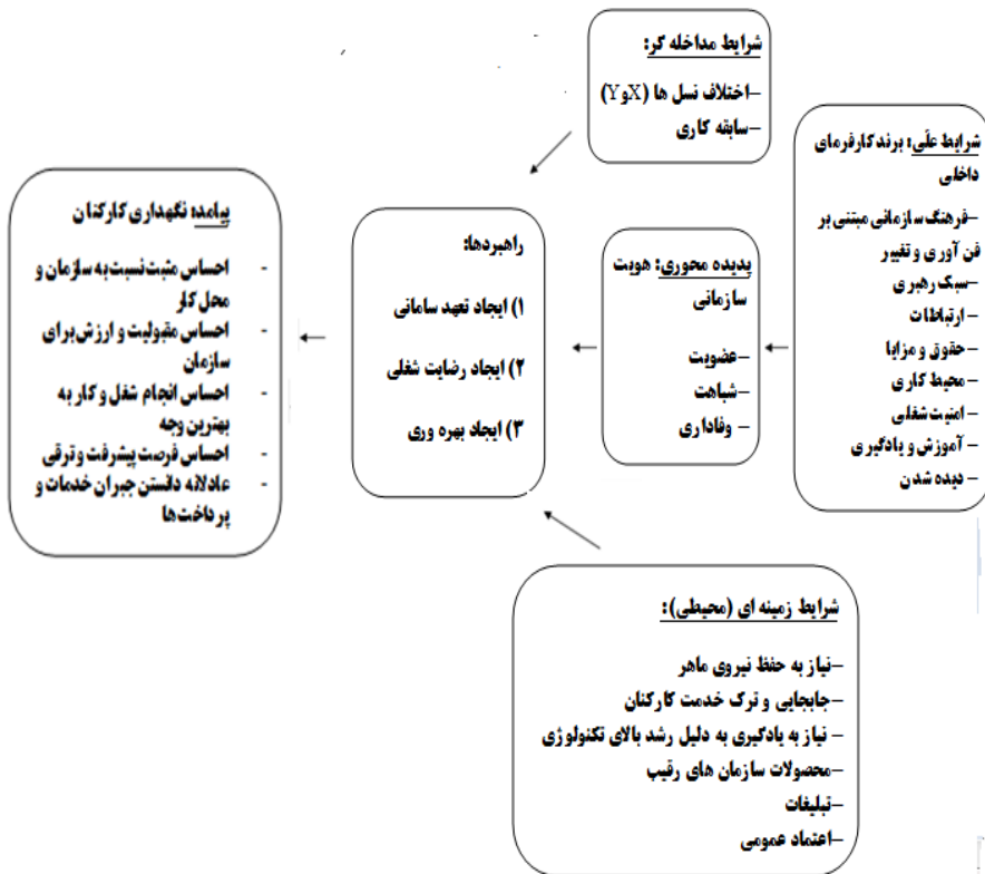
Figure 1. (the conceptual model of the research)

همان‌طور که در مدل پژوهش مشخص می‌باشد، مقوله‌های اصلی و زیرمقوله‌های آنها به شرح زیرند و بدین‌گونه تمام سؤالات تحقیق پاسخ داده می‌شوند.