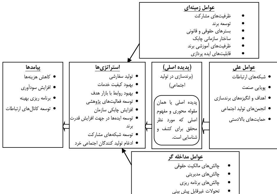
شکل شماره ۲. الگوی پارادایمی برند سازی در تولید اجتماعی در راستای بهبود عملکرد صنعت پوشاک داخلی Figure 2: A paradigm model for branding in social production to improve the performance of the domestic garment industry

در این تحقیق برای کدگذاری محوری از استراتژی گراندد تئوری با رهیافت استرواس و کوربین استفاده شد. این پارادایم چهارچوبی منسجم است که به کمک آن می‌توان روابط احتمالی میان مقوله‌ها را مورد سنجش قرار داد و از طرفی دیگر امکان فهم نسبتاً جامع پدیده مورد نظر را فراهم می‌کند، زیرا در آن عوامل علی و زمینه‌ای که موجب روی آوردن کنشگر، به فعالیتی خاص، که همان مقوله محوری است می‌شود، راهبردهایی که برای مدیریت وضعیت پیش‌آمده و تحقق بخشیدن به مقوله محوری اتخاذ می‌شود، عوامل مداخله‌گری که مانع تأثیرگذاری عوامل علی و زمینه‌ای بر مقوله محوری می‌شود، و پیامدهایی ناشی از راهبردهای اتخاذی مشخص می‌شوند. مدل پارادایمی پژوهش حاضر در ذیل ارائه شده است: