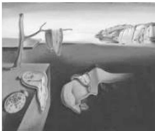
«استمرار خاطره» اثر سالوادور دالی

«دالی» در این باره می‌گوید: «زمانی که نقاشی‌هایم را می‌کشم، خود نمی‌فهمم چه معنایی می‌دهد، اما این دلیل بر بی‌معنایی آن‌ها نیست.» (دوشان ۹۳)