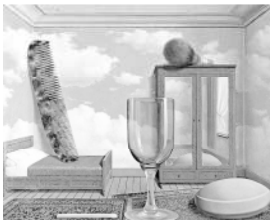
«ارزش‌های شخصی» اثر رنه ماگریت

«ماگریت» خود، روش‌های خویش را برشمرده است: «قرار دادن اشیاء در جاهای غیرعادی، آفریدن اشیای تازه، تغییر شکل اشیای آشنا، عوض کردن مادهٔ اشیاء، به کار بردن کلمه و تصویر با هم ...».