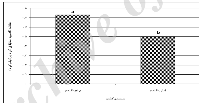
شکل ۱- مقایسه میانگین اثر سیستم کشت بر غلظت کادمیوم ساقه

*، ** و ns = به ترتیب معنی دار در سطوح احتمال ۵، ۱ درصد و غیر معنی دار ns, ** and * : non significant, significant at the 5% and 1% probability levels, respectively.